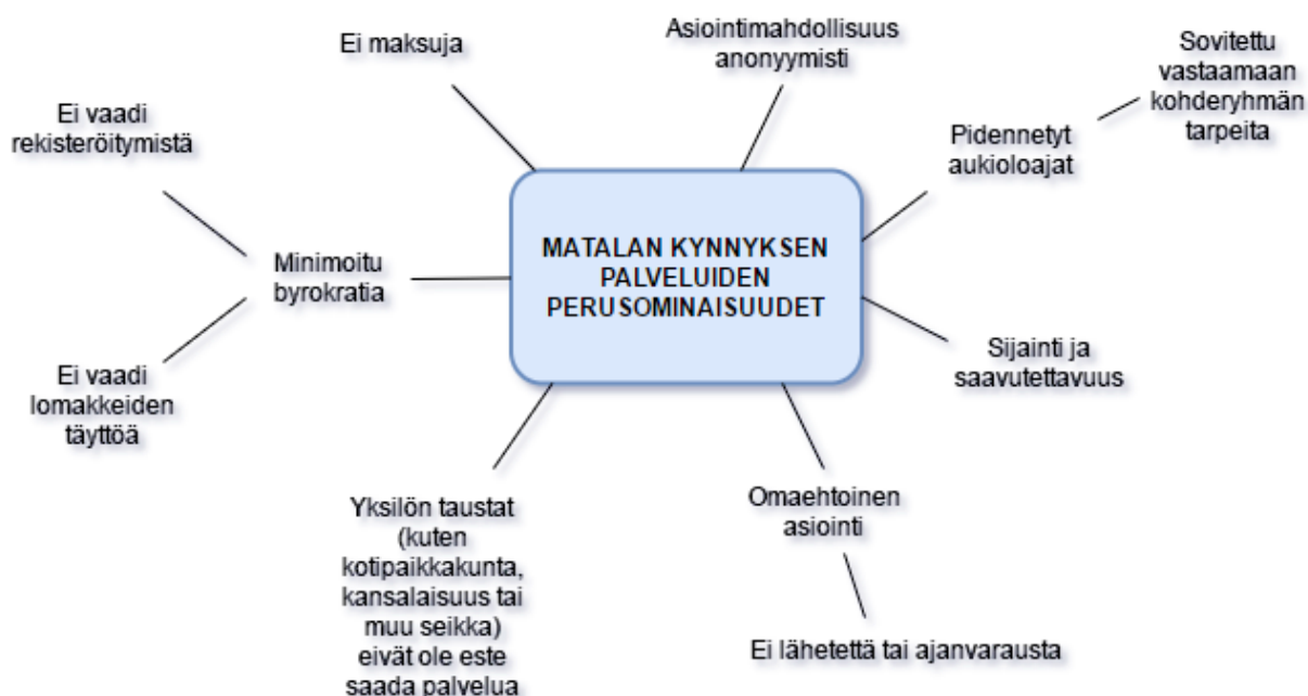
(Kuvio 1 Matalan kynnyksen palveluiden perusominaisuuksista)

Taloudellisella lamalla oli suuri vaikutus matalan kynnyksen palveluiden vakiintumisessa Suomeen 1990-luvulla. Laman luomat haasteet kuten köyhyys ja julkisten palveluiden heikenneet resurssit lisäsivät ihmisten avuntarvetta. Laman jälkeen hyvinvointivaltiota kohdannut kriisi antoi kuitenkin kolmannelle sektorille tilaa ja mahdollisuuden ottaa aikaisempaa suuremman roolin Suomessa. Järjestökenttä ja vapaaehtoiset ottivat yhä laajemmin vastuuta varsinkin erityispalveluiden tarjoamisessa ja kehittämisessä julkisten palveluiden niukkojen resurssien tähden, mikä mahdollisti matalan kynnyksen palveluiden laajenemisen. Näin ollen järjestöillä on ollut alusta asti keskeinen rooli matalan kynnyksen palveluiden järjestämisessä ja tarjoamisessa. Perinteisesti matalan kynnyksen palveluiden suurin rahoittaja on entinen Raha-automaattiyhdistys (RAY) ja nykyinen fuusioitunut Sosiaali- ja terveysjärjestöjen avustuskeskus (STEA). (Leemann, Hämäläinen 2015, 5-6.)