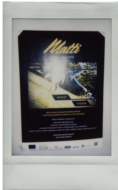
Kuva 1. Pikafilmi, jolle on kuvattu Matti -hankkeen esite (Sundström, Rainer 2017)

Suunnitelmamme oli, että rakennamme sosiokulttuurisen innostamisen teoreettisen viitekehykseen (mm. Kurki 2000: 19, 46-47) perustuvaa toimintaa, johon osallistuville nuorille tarjoutuisi valokuvatyöskentelyn keinoin mahdollisuus oppia tunnistamaan omia vahvuuksiaan, sekä seuraamaan omaa edistymistään työpajalla. Käytännön toteutuksessa nuoret kuvaisivat tunnistamiaan vahvuuksia, sanoittaisivat niitä valokuvan avulla ja että toiminnasta jäisi pikafilmin myötä myös konkreettinen esine muistoksi. Tekemiään havaintoja nuoret voisivat hyödyntää hakeutuessaan koulutukseen tai työelämään ja ne toimisivat myös itsetunnon vahvistamisessa. Työssä havainnoitaisiin itseohjautuvuusteorian (Ryan & Deci 2002: 7–9) esittämiä henkilökohtaiseen kasvuun vaikuttavia mekanismeja.