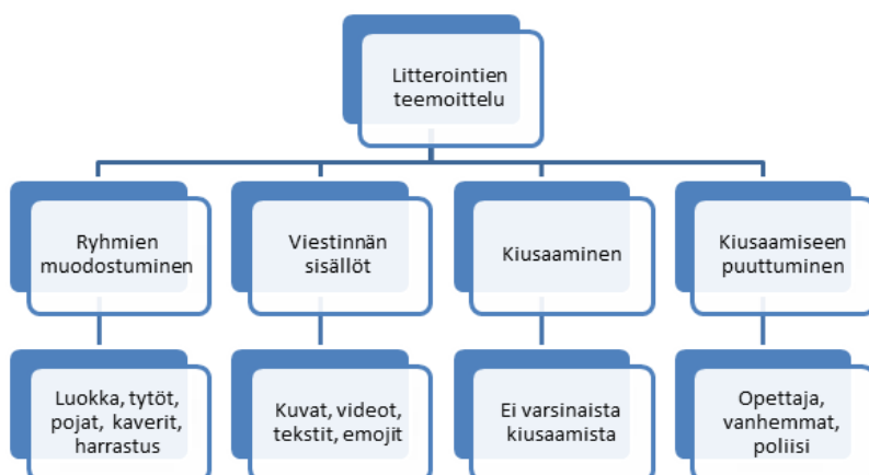
Kuvio 2. Litteroinnin teemoittelu