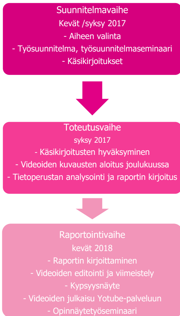
KUVIO 2. Opinnäytetyön prosessi