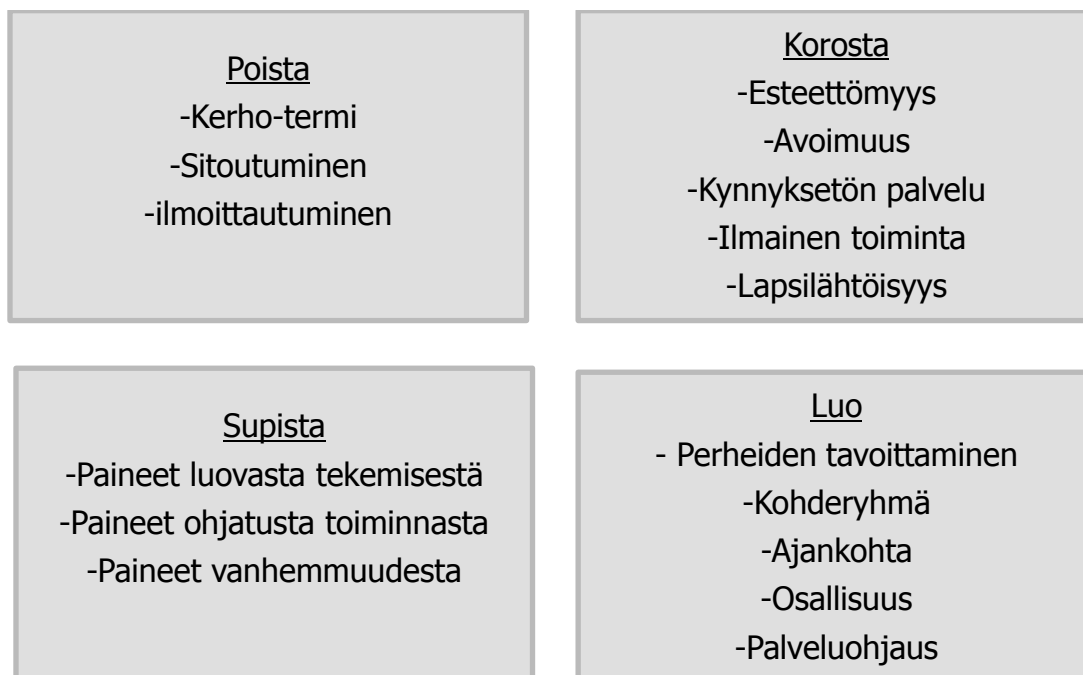
KUVIO 4. Sinisen meren strategian nelikenttä analyysi

Kuviossa 4 on esitelty sinisen meren strategian avulla toiminnan jatkokehitysmalli. Aluksi pohdimme, mitä nykyisestä toiminnasta tulee poistaa. Ajatuksena nousi esille, että kerho-termin käyttäminen saattaa luoda vääränlaisen kuvan toiminnasta. Kun puhutaan kerhotoiminnasta perheet voivat kokea sen sitovana toimintana ja tämän takia karttavat toimintaa. Kerho-termin käyttäminen voi tehdä toiminnasta vaikeammin lähestyttävää, eikä se silloin täytä matalankynnyksen palvelun edellytyksiä. Kuitenkin kerho-termi voi luoda myös turvallisuuden tunnetta, sillä kerhossa ryhmä ja ohjaajat pysyvät usein samana. Etenkin erityistä tukea tarvitseville lapsille tämä on merkityksellistä. Jatkokehitysideana kerho sana tulisi korvata esimerkiksi toiminta sanalla, jolloin toiminta kuulostaa helpommin lähestyttävältä. Matalankynnyksen palvelua kehittäessä on tärkeää, etteivät perheet koe painetta sitoutua toimintaan. Lapsiperheen arki voi olla hektistä ja arjessa on omat haasteensa. Toiminnan tulisi olla sellaista, minne voi tulla silloin kun perheelle sopii, eikä haittaa, jos yksi kerta jää välistä. Tällöin perheillä on matalampi kynnyks osallistua toimintaan. Tästä samasta syystä toiminnan tulisi olla avointa kaikille, ilman sitoutumista ja ilmoittautumista. Tämä tekee toiminnasta kynnyksetöntä toimintaa.