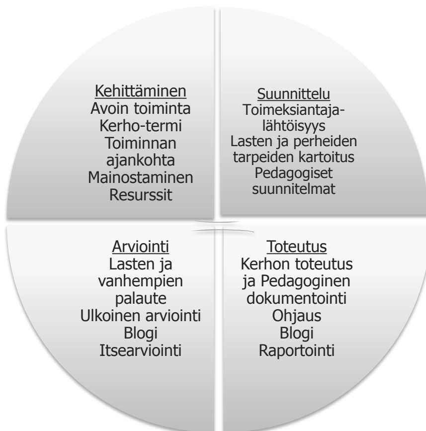
KUVIO 3. Kehittämistyön eteneminen Demingin ympyrässä

nyksen palvelua. Suunnitteluvaiheen jälkeen toteutimme kerhokerrat. Kerhokerrat suunnittelimme lapsia osallistaen ja heidän toiveitaan kuunnellen. Pedagogisella dokumentoinnilla oli suuri merkitys toteuttaessa kerhoa. Sen avulla loimme toiminnalle oman blogin. Arviointivaiheessa pyysimme lapsilta ja vanhemmilta palautetta ja näin pystyimme kehittämään toimintaa jokaisen kerran jälkeen. Kerhokertojen jälkeen saimme myös toimeksiantajalta palautteen, jonka pohjalta pohdimme kerhon jatkokehitysideoita.