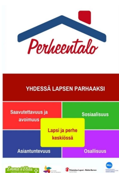
KUVIO 1. Perheentalon toimintamalli (Iisalmen Perheentalo s.a)

Perheentalo on matalan kynnyksen toimipaikka, joka tukee perheiden arkea ja lisää osallisuuden mahdollisuutta. Perheentalon toiminta on verkostomaista, ja se toimii yhdessä useiden eri toimijoiden kanssa. Toiminnan tavoitteena on vakiinnuttaa uudenlainen, kolmannen sektorin varhaisen tuen kumppanuusmalli lapsiperheille. Perheentalolle voi mennä viettämään aikaa, tapaamaan muita perheitä ja siellä on mahdollisuus pelata ja leikkiä sekä näiden lomassa syödä esimerkiksi omia eväitä ja juoda kahvia tai teetä. Perheentalon toiminta perustuu lapsi- ja perhelähtöisyyteen. Kuopion Perheentalolla järjestetään useita erilaisia toimintoja, kuten vertaiskohtauksia, erilaisia ohjattuja lapsiryhmiä, hyvinvoinnin tukea, erilaisia tilaisuuksia ja tapahtumia sekä esimerkiksi vaikuttamistoimintaa, jossa lasten osallisuus korostuu. (Kuopion Perheentalo 2017.)