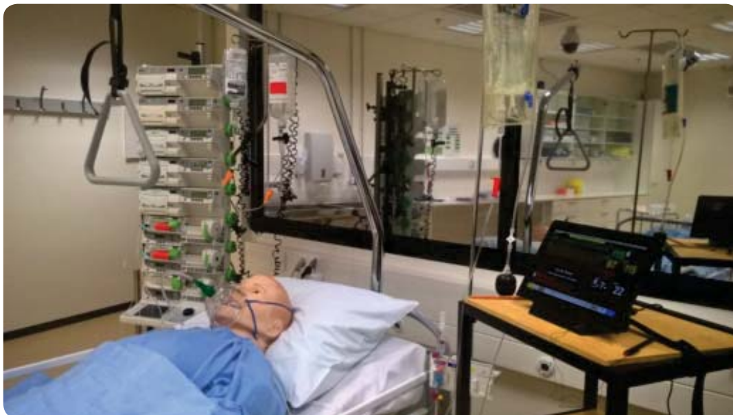
Kuva 1. Potilassimulaattori

Loput ryhmästä seuraavat harjoitusta toisesta tilasta kamerayhteyksien avulla ja kommentoivat harjoituksen tapahtumia matkapuhelimen tai tabletin välityksellä.