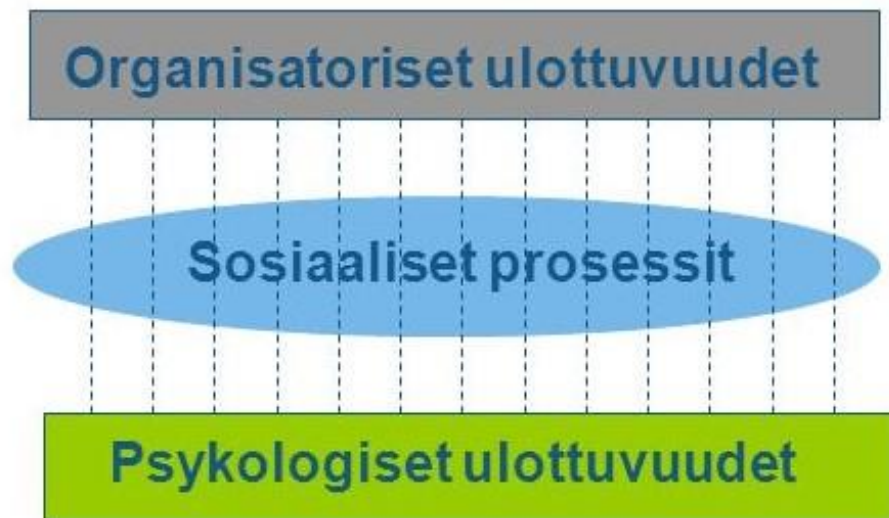
Oppilaitoksen turvallisuuskulttuurin ulottuvuudet. (Lindfors 2012, 19 mukailleen)

Kyllösen ja Rickmanin (2011, 19) mukaan koulun henkilöturvallisuuden nykytilaan ja sen kehittämiseen päästään käsiksi kolmea osa-aluetta kartoittamalla, mikä tapahtuu arvioimalla riskejä. Ensimmäinen osa-alue, fyysinen työympäristö, käsittää koulun rakenteisiin liittyvät henkilöturvallisuuteen olennaisesti vaikuttavat seikat. Toinen osa-alue, työntekijän ammatilliset valmiudet, sisältää esimerkiksi vuorovaikutuksellisten keinojen ja tilanteiden ennakoitaitojen hallinnan koulun arjessa sekä haastavissa kohtaamisissa oppilaiden ja vanhempien kanssa. Kolmannella osa-alueella, henkilöstön yhteistoiminnalla, viitataan henkilöturvallisuuden alueella kaikkien yhteistyössä sovittujen ja harjoiteltujen menettelyjen sekä pelisääntöjen kollektiiviseen noudattamiseen.