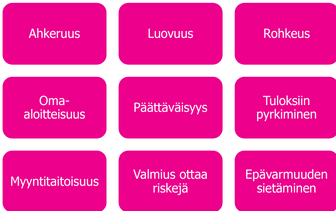
KUVIO 1. Tärkeitä ominaisuuksia yrittäjälle (Perustamisopas alkavalle yrittäjälle 2017).

Maksavat asiakkaat eivät vain kävele luokse, vaan niitä on osattava etsiä. Yrittäjä erottuu toisista luovuudellaan. Luovuutta on monenlaista. Yrittäjä voi käyttää luovuutta omiin tuotteisiinsa tai palveluihinsa tai siihen, kuinka niitä markkinoi ja erottuu sitä kautta muista yrittäjistä. (Perustamisopas alkavalle yrittäjälle 2017.)