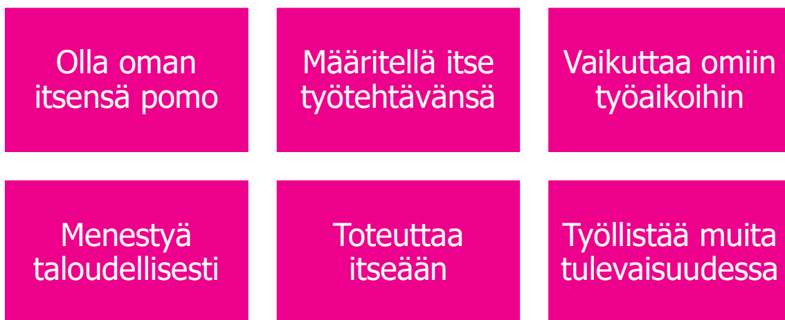
KUVIO 2. Yrittäjäksi ryhtymisen antamia mahdollisuuksia (Perustamisopas alkavalle yrittäjälle 2017).

Yllä olevasta kuviossa (KUVIO 2.) on yrittäjyyteen motivoivia tekijöitä/mahdollisuuksia. Yrittäjää voivat motivoida monet eri mahdollisuudet, tai yrittäjä tarvitsee toiminnalleen vain yhden motivaattorin. Silti yrittäjyyttä suunnittelevan on tunnettava toimiala, jolle suunnittelee yritystä perustavansa. Lisäksi aloittavalla yrittäjän tulisi tuntea taloushallinnon perusteet, hinnoittelu, budjetointi ja markkinointi, joita on kuitenkin koulutusten avulla mahdollista omaksua. Yrittäjäksi ryhtyminen ei tarkoita, että yrittäjänä on toimittava koko ikänsä. Toisille yrittäjyys on vain yksi vaihe, vaikka usein yrittäjät pysyvätkin yrittäjyyden ympärillä.