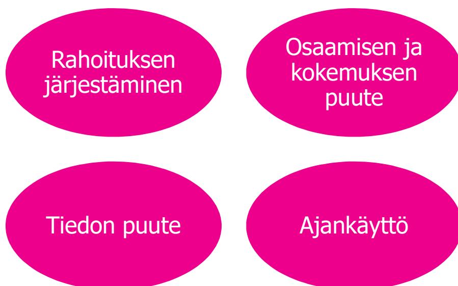
KUVIO 3. Yrittäjäksi ryhtyvän haasteita (Perustamisopas alkavalle yrittäjälle 2017).

Yrittämisessä on aina haasteita, esimerkkejä löytyy alla olevasta kuviossa (KUVIO 3.) Aloittavan yrittäjän haasteena on löytää yritykselleen rahoitusta. Yrittäjällä saattaa olla puutteita osaamisessa ja kokemuksessa. Tiedon puute esimerkiksi lainsäädännöstä, verotuksesta tai sopimuskäytänteistä saattaa aiheuttaa ongelmia jo jonkin aikaa yrittäjänä toimineelle. Suurin haaste yrittäjälle saattaa kuitenkin olla ajankäyttö. Yrittäjän täytyy pystyä erottamaan toisistaan työ ja vapaa-aika. (Perustamisopas alkavalle yrittäjälle 2017.)