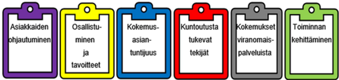
KUVIO 3. Analyysisissä käytetyt värikoodit teemoittain

Värikoodien käyttäminen tiivistä käsiteltäviä tekstiosuuksia oleellisesti jättäen haastatteluaineistosta pois tutkimuksen kannalta ylimääräisen ja epärelevantin tiedon. Koko purtetu haastattelumateriaali ja nauhoitetallenteet sen sijaan säilytettiin omissa alkuperäisissä tiedostoissaan mahdollista asioiden tarkistamista sekä hyödyntämistä varten.