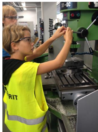
Abbildung 1: Übung Koordinatensystem. Eine Schülerin an der Bohrmaschine