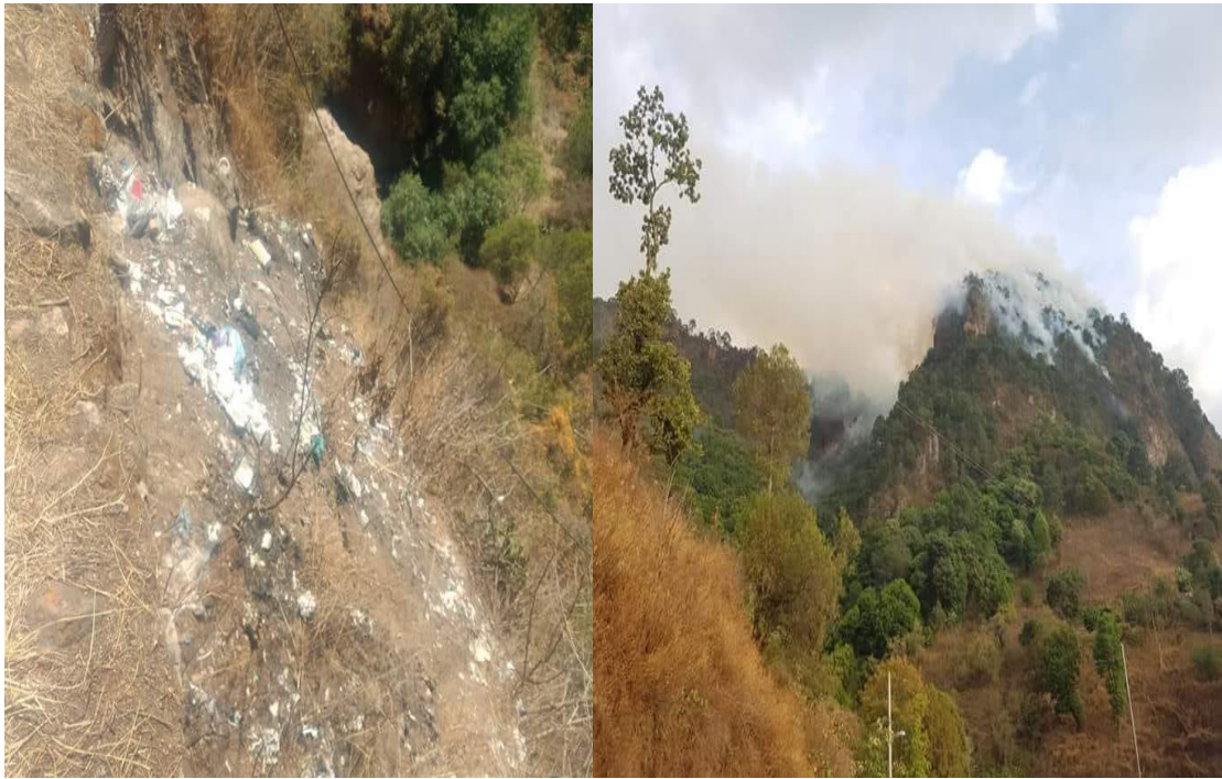
Algunas problemáticas ambientales en el territorio Sultepequense.