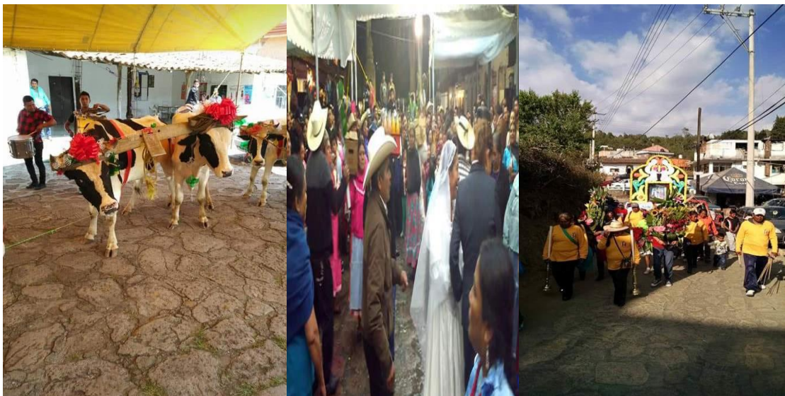
Algunas tradiciones y costumbres de los habitantes del municipio de Sultepec.