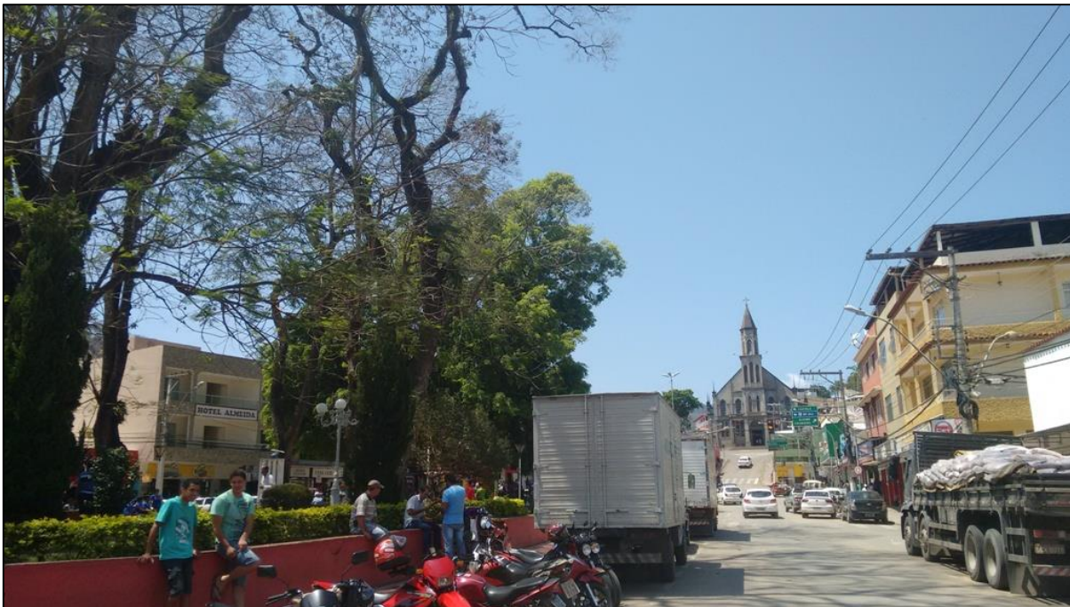
Vista parcial do centro de Muniz Freire, em 29 de setembro de 2016.