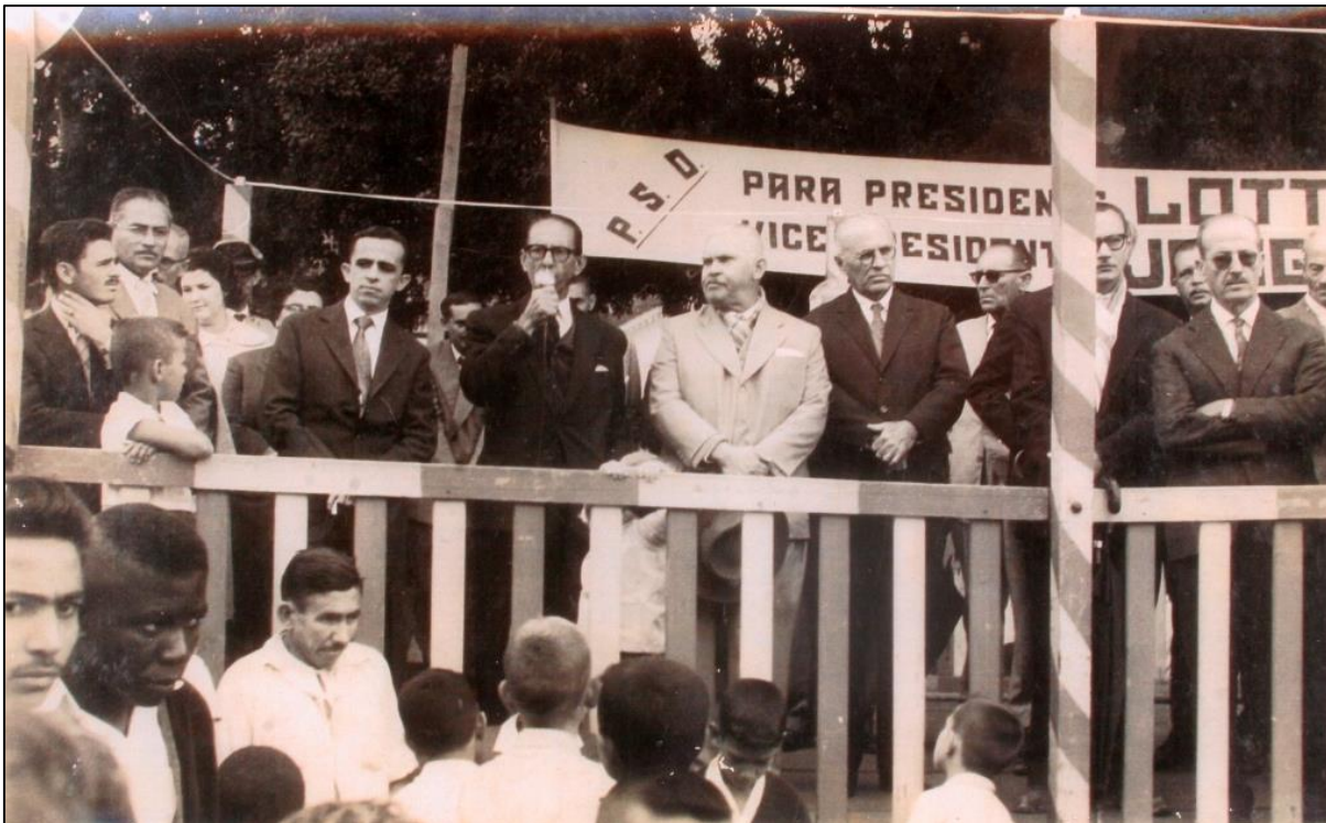
Evento contou com a presença do governador Carlos Fernando Monteiro Lindenberg (terceiro da direita para esquerda) ao lado de autoridades locais. Ao fundo, uma faixa de apoio as candidaturas do Marechal Henrique Teixeira Lott e João Goulart.