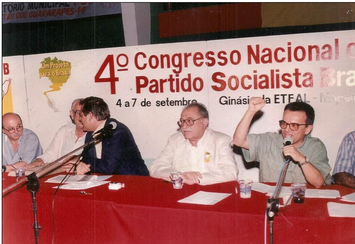
Renato discursa ao lado de Miguel Arraes no 4º Congresso Nacional do Partido Socialista Brasileiro (PSB) em 1993.