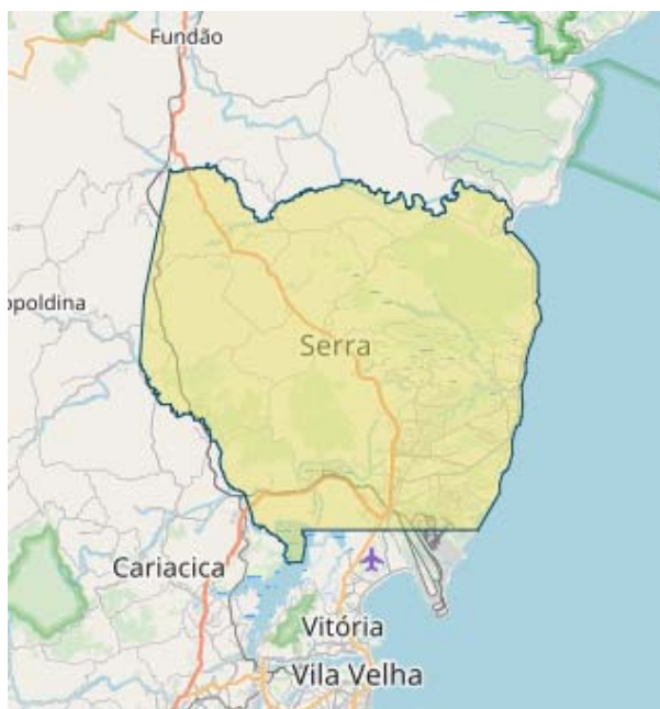
Mapa 1 – Município de Serra/ES