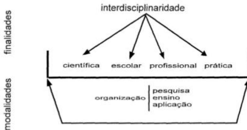
Figura 1 - Os campos de operacionalização da interdisciplinaridade e seus ângulos de acesso

Em qualquer que seja o campo de operacionalização da interdisciplinaridade, ele poderá ser investigado (pesquisa), professado (ensino) ou praticado (aplicação), conforme demonstrado na figura abaixo.