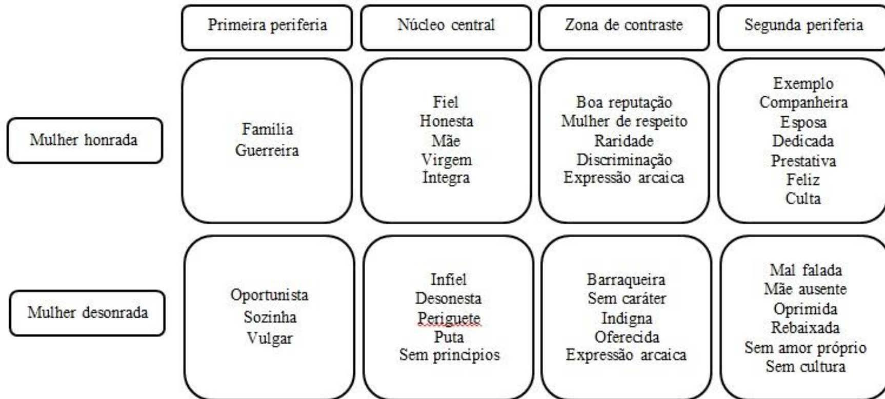
Figura 3.1. Esquema comparativo entre as representações sociais dos objetos mulher honrada e mulher desonrada a partir da análise hierarquizada das associações livres.