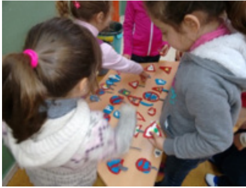
Imagen 2. Señales de plastilina elaboradas por los niños y niñas de 5 años para afianzar el formato de las señales