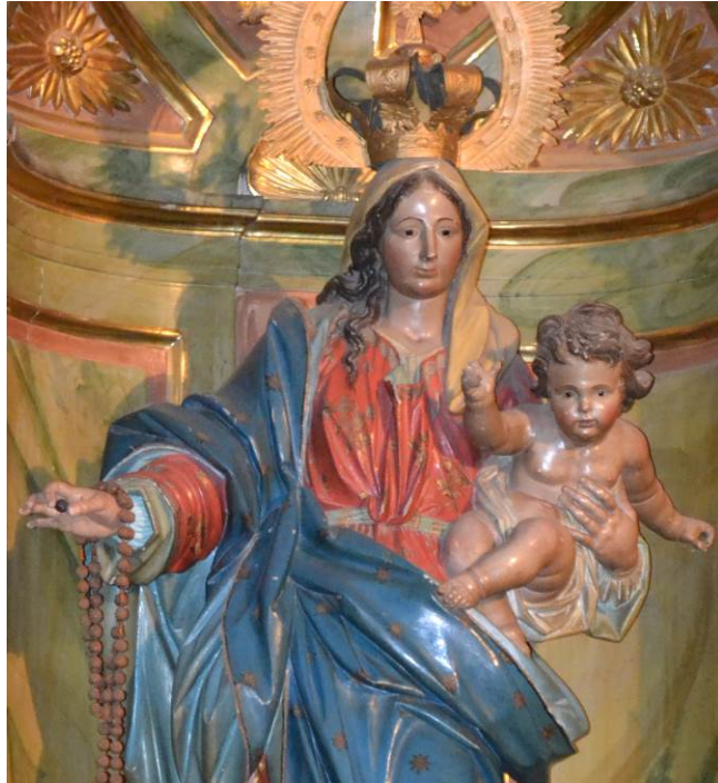
Imagen 5. Virgen del Rosario (detalle). Iglesia parroquial de Navarrete (La Rioja)