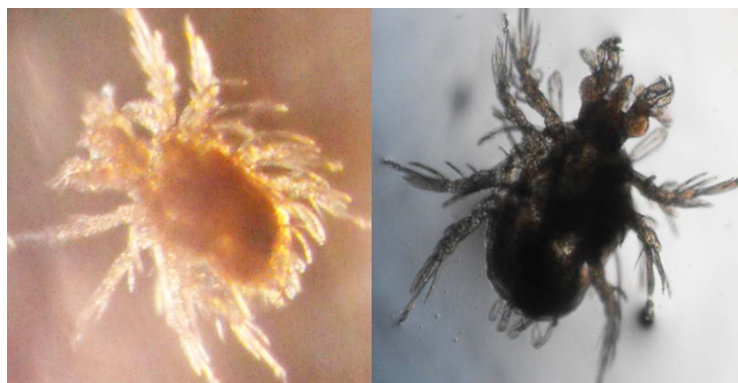
Figura 4. Ácaros del polvo obtenidos de una tela de yute que cubría un multifuncional. (Foto: Helisama Colín Martínez).

Los ácaros del polvo brindan una función importante al alimentarse de células de piel muerta y otras partículas de materia orgánica que producimos cada segundo, por lo que son considerados limpiadores de los desechos celulares del ser humano. Sin embargo desde el punto de vista de salud pública, sus deyecciones y sus restos pueden causar alergias respiratorias a personas susceptibles a sus excrementos (Strass et al. 2002).