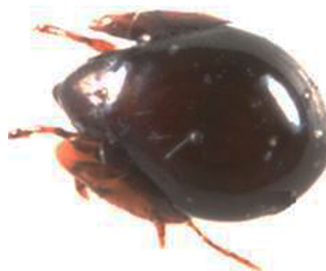
Figura 3. Ácaro de la familia Galumnidae.

Hay ácaros del suelo que son muy abundantes en suelos orgánicos (figura 3), su densidad puede alcanzar miles de individuos por metro cuadrado y de 50 a 100 especies (Norton 1990). Se alimentan de plantas vivas o muertas y de carroña, algunos son predadores, que se alimentan de nematodos vivos (Siepel 1990). Son importantes ecológicamente debido a que su excremento ayuda a la descomposición primaria y proporcionan una parte importante de nitrógeno, considerándose indicadores del suelo (Minor 2004).