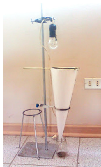
Figura 1. Extracción de ácaros de una muestra de suelo.

Un muñeco de peluche que no se haya lavado por lo menos durante cuatro meses, un frasco con 20 mililitros de etanol al 70 %, una bolsa de plástico del tamaño del muñeco de peluche, dos hojas de color blanco, refrigerador, una pinza de disección de punta fina, un microscopio estereoscópico y uno óptico o de