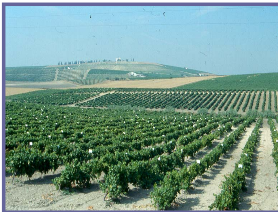
Figura 1. Colección de vides del IFAPA Centro Rancho de la Merced

Para la realización de este trabajo se han analizado 702 accesiones de vid que se conservan en el banco de germoplasma del Centro IFAPA Rancho de la Merced (Figura 1) (García de Luján and Lara 1997). La colección del IFAPA incluye accesiones denominadas con el mismo nombre y localizadas en subparcelas distintas porque tienen diferente procedencia.