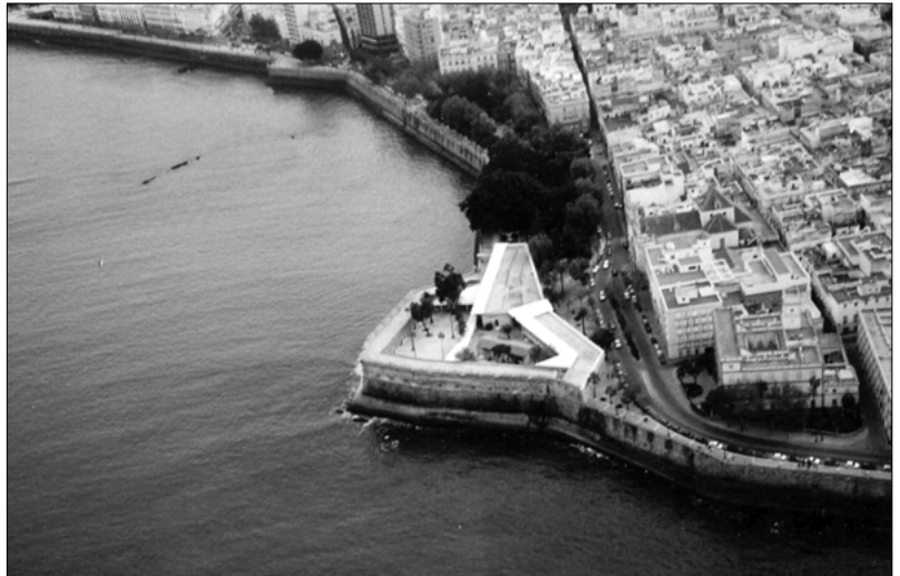
1. Cádiz. Vista del Baluarte de Candelaria y de la zona oeste de la muralla.

Desde este punto de vista, la actual costa de Andalucía Occidental revestía y reviste un especial interés al ser el centro de conexión de lo mediterráneo, atlántico y africano. Ámbitos estos que, en determinadas etapas históricas y por unas razones u otras, alcanzaron diferentes grados de importancia. Su límite actual abarca desde la desembocadura del Guadiana, protegida por la ciudad de Ayamonte, hasta la bahía de Algeciras. En ese marco se sitúan distintas ciudades que de alguna manera poseen elementos de arquitectura militar en sus términos.