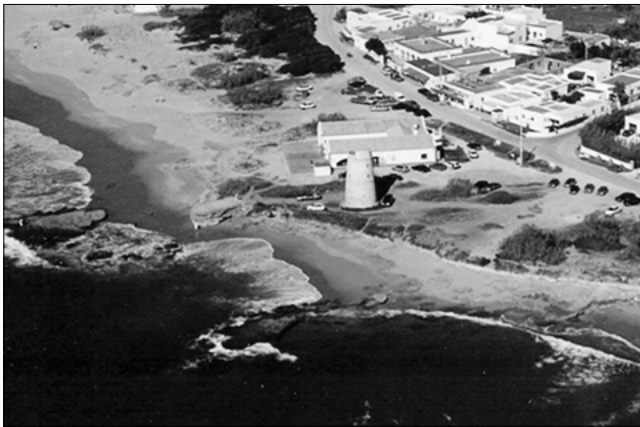
10. Conil. Vista de la Torre de Castilnovo.