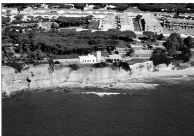
6. El Puerto de Santa María. Vista de los restos del castillo de Santa Catalina.