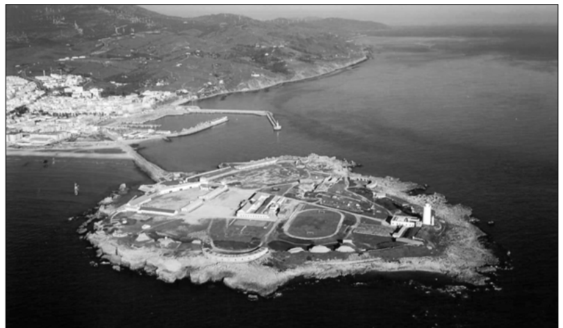
17. Manilva. Vista de Torre Chullera.