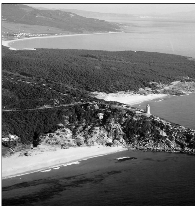
15. Tarifa. Torre del Camarinal.