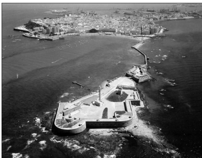
2. Cádiz. Vista del castillo de Santa Catalina y parte de la playa de la Caleta.