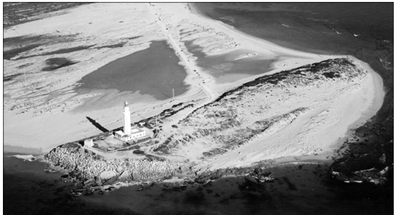
13. Barbate. Torre del Tajo.