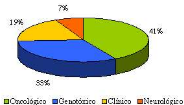
Figura 1.- Porcentaje de respuestas que discriminan los tipos de daño inducido por radiaciones ionizantes.