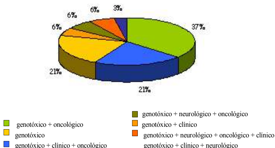
Figura 2.- Porcentaje de respuestas que evidencian los distintos tipos de asociaciones con el riesgo genotóxico.

En cuanto a la protección radiobiológica, teniendo en cuenta la disponibilidad y uso de dosímetros personales, los resultados reflejan que tan sólo el 53,6% de los individuos tienen acceso a estos dispositivos. Un análisis particular entre entidades públicas y privadas resalta que las dos terceras partes de estos individuos se desenvuelven en instituciones públicas (relación público/privado 2,32). Por otro lado, en referencia a la disponibilidad de chalecos plomados la misma se satisface en el 96,4% de la muestra. A pesar de ello, tanto en instituciones privadas como en las dependientes de Salud Pública se observa que sólo la mitad de los encuestados los utilizan. Estos resultados llaman la atención respecto a la disponibilidad y uso de dosímetros personales e indumentaria. Lo esperado sería que la totalidad de los individuos que trabajan en este área puedan acceder a ellos y utilizarlos de manera adecuada. Sin embargo, se observa cierta falencia en el acceso a dosímetros y negligencia en el uso de la indumentaria que poseen. No obstante, pese a la difícil situación por la que atraviesa la Salud Pública en nuestro país, se podría sugerir un cumplimiento más adecuado de las medidas mencionadas en el sector público.