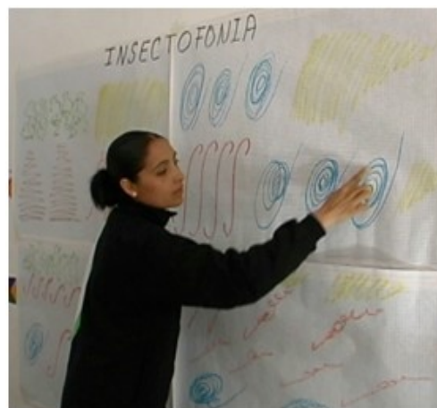
Figura 7. Las grafías se utilizaron para contar un cuento musical.

Se solicitó a los niños que fabricaran un instrumento cuyo sonido fuera similar al producido por el insecto de su preferencia. Esta actividad no solo puso a prueba sus inteligencias para