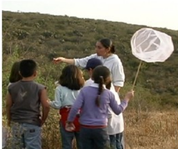
Figura 3. Colecta de insectos en el campo.

c) Colecta. Para ésta utilizamos dos tipos de redes entomológicas fabricadas por los alumnos. Conforme atrapaban a los insectos se les explicaba aspectos generales de su biología (figura 3).