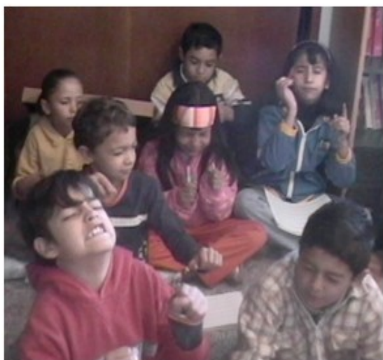
Figura 6. La creación de las grafías implicó la audición, concentración, imaginación, movimiento corporal y representación en el papel.

a) Los niños debían escuchar el sonido de cada insecto