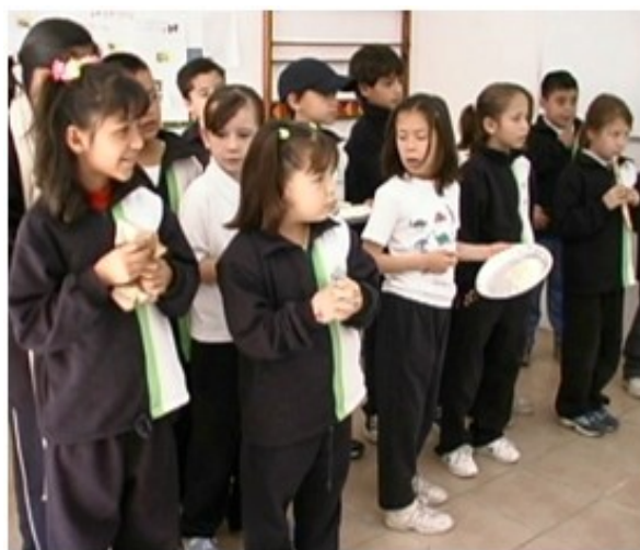
Figura 8. Orquesta “insectofónica”.

La coreografía incluyó el movimiento de las hormigas cuando forman una hilera para recoger alimento; del escarabajo toro cuando está defendiendo su territorio y consiguiendo hembras; de una oruga de mariposa que se está alimentando y de insectos saltadores como los chapulines (figura 9).