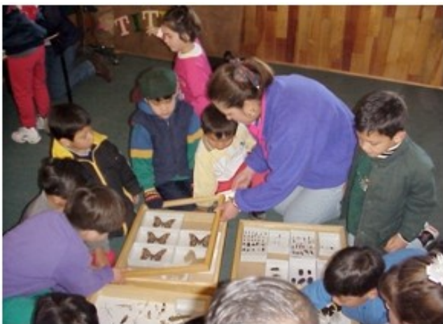
Figura 1. Observando la diversidad de los insectos.

Primero se realizó una presentación con fotografías y videos de insectos para que los niños empezaran a familiarizarse con la forma y la diversidad de estos organismos. Después, los alumnos reunidos alrededor de colecciones entomológicas observaron y analizaron la estructura básica de los insectos (figura 1), utilizando un programa interactivo diseñado para este proyecto y que sirvió como clave entomológica.