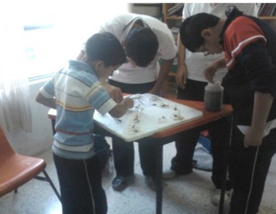
Figuras 4 y 5. Alumnos de diferentes grados escolares compartiendo sus saberes unos con otros para hacer la colección de insectos.