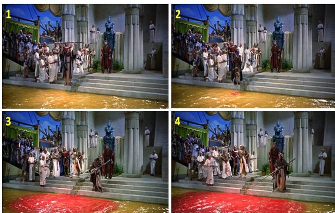
Figura 1. Escenas de la película Los Diez Mandamientos (1956), de Cecil B. DeMille, donde Aarón levanta el báculo y lo introduce en el río Nilo en presencia de Moisés, Ramsés y todo el séquito de este último. La introducción del báculo simuló la transformación de las aguas del río en sangre.

En la propia película, Ramsés da una posible explicación ante Moisés y un sacerdote cuando dice: "...Yo también tuve miedo al enrojecerse el Nilo, hasta que supe de un monte, más allá de las cataratas, que despidió barro rojo y emponzoñó el agua". El barro rojo presenta en su composición una mezcla de arcillas y óxidos de hierro, siendo éste el elemento con el que se trabajará en esta experiencia. En clase, si el docente pregunta cómo se produjo el cambio de color, las respuestas siempre serán de lo más variadas y sorprendentes por parte del alumnado, quienes se asombran cuando se les dice que van a realizar la práctica en un laboratorio que reproducirá el efecto observado en la película.