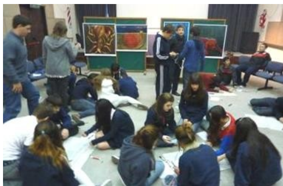
Figura 4. Estudiantes de una escuela secundaria participando activamente del taller.

La evaluación de la experiencia resultó altamente satisfactoria, y de la reflexión sobre lo transitado -durante la organización y en la implementación- surgen múltiples aprendizajes tanto para participantes como para organizadores.