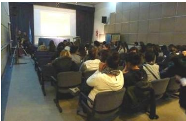
Figura 5. Charla a cargo de especialistas en el auditorio del museo.