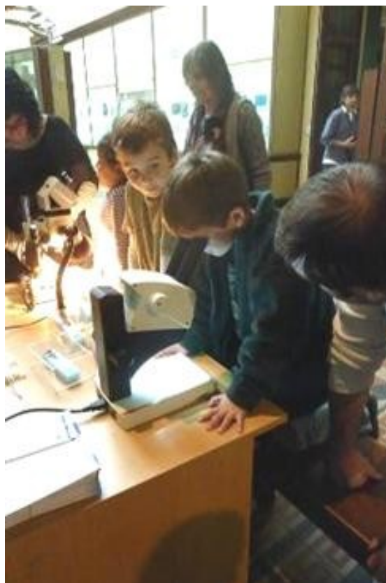
Figura 6. Observación de vinchucas en la sala de Entomología durante el fin de semana.

En cuanto a la articulación intergrupala e interinstitucional, el trabajo entre personas pertenecientes a diferentes instituciones, tradiciones laborales, modalidades de funcionamiento y organización, requirió un esfuerzo de coordinación y gestión de acuerdos y construcción de códigos comunes, que posibilitaron la participación conjunta y el sostenimiento del espacio. Así, pudimos entrelazar los aportes de: