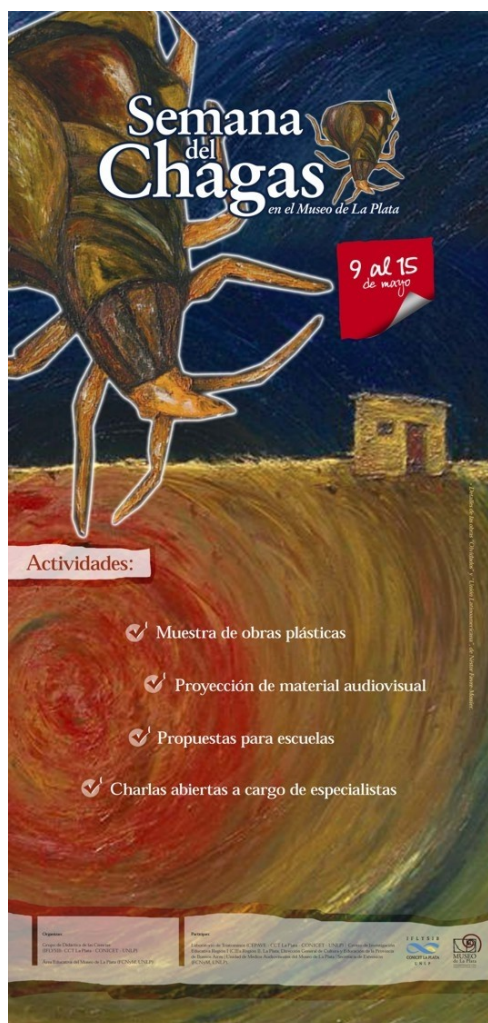
Figura 1. Banner de difusión de la Semana del Chagas en el Museo de La Plata (2011).

visual un video ilustración que muestra el proceso creativo de la realización de 5 imágenes en acrílico que ilustran los ejes temáticos del texto. Grupo de Didáctica de las Ciencias y El Birque Animaciones (Argentina, 2010).