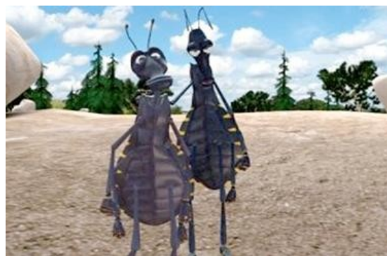
Figura 3. Imagen tomada del video "Cada quien para su casa, la enfermedad de Chagas" (México, 2008).

Se incluyó este video en la charla del día martes y se proyectó de manera continuada en la Sala Víctor de Pol durante el fin de semana.