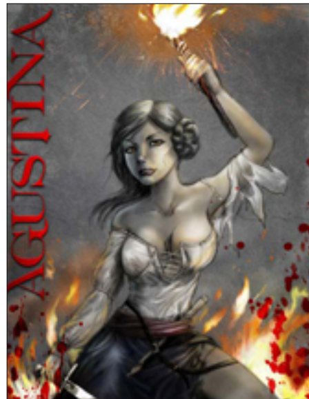
Ilustración 3 : En algunos momentos, el aspecto de Agustina (con unos pocos probables pantalones y pistola) llega a recordar más al de personajes como la Princesa Leia de Star Wars que a una aragonesa de principios del siglo XIX.

Actualmente, el guionista Rafael Marín Trechera está escribiendo en la actualidad una serie de doce títulos, dibujados por artistas de renombre internacional, como puedan ser Mateo Guerrero, Sergio Bleda o Paco Roca. La iniciativa, promovida por la Diputación Provincial de Cádiz, se centra principalmente en la Constitución de 1812, adoptando un acercamiento parecido al de los Episodios Nacionales de Galdós, a saber, personajes ficticios que contemplan y participan de los hechos históricos junto a sus protagonistas reales. Hasta la fecha han