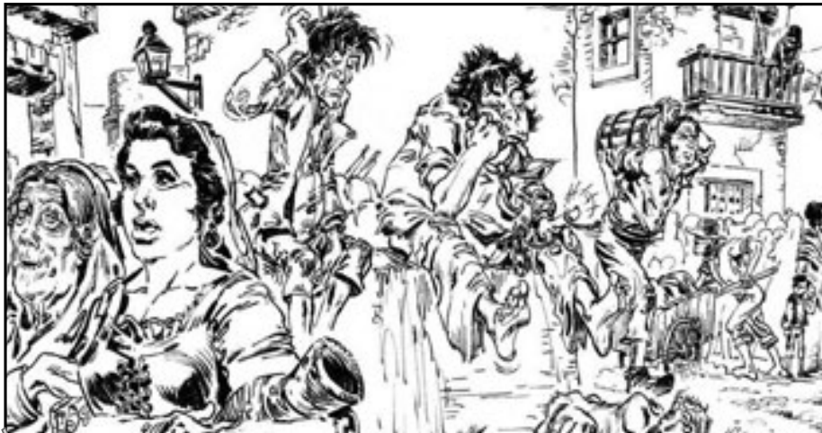
Ilustración 1: Una imagen vale más que mil palabras. En una sola viñeta se nos muestra una escena cotidiana del Cádiz de 1810, donde vemos las ropas, las herramientas, los peinados y la arquitectura de la época. En un texto escrito habría costado varias líneas, tal vez varios párrafos, alcanzar el mismo nivel de detallismo. ROMERO, Antonio (dibujante); y MARÍN, Rafael (guionista): 12 del Doce: La Barca, Cádiz, Servicio de Publicaciones de la Exma. Diputación de Cádiz, 2010,

absorbentes que los tebeos, al menos a ojos de los adolescentes (televisión, videojuegos, Internet, etc.), por lo que hemos de enfrentarnos a la posibilidad de que parte de nuestro alumnado no esté tan siquiera familiarizado con la narrativa de la historieta, su estructura, e incluso es posible que directamente lo desechen. 3 Además, hemos de saber escoger obras apropiadas a nuestros intereses pedagógicos.