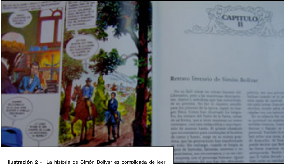
Ilustración 2 - La historia de Simón Bolívar es complicada de leer para un lector actual. El cómic es más bien un libro de texto en el que ilustraciones carentes de narración pero cargadas de información son sucedidas por textos divulgativos.

Con el bicentenario de la Guerra de Independencia se ha publicado Agustina de Aragón del guionista Fernando Monzón, una obra con un dibujo mucho más atractivo y que introduce a los lectores al personaje de Agustina, que se nos muestra como una mujer aguerrida, aunque su apariencia tiene más que ver con los gustos actuales que con el aspecto real que debió poseer el personaje histórico (ilustración 3). 4 Por ello, aunque la obra puede utilizarse, es necesario poner de manifiesto qué es real y qué meramente un recurso narrativo para hacer más atractiva la historieta a ojos del público actual. Por otro lado, ésta es una de las pocas obras en las que encontramos a una mujer como protagonista, por lo que es ideal para tratar aspectos sobre igualdad y roles de género en el aula.