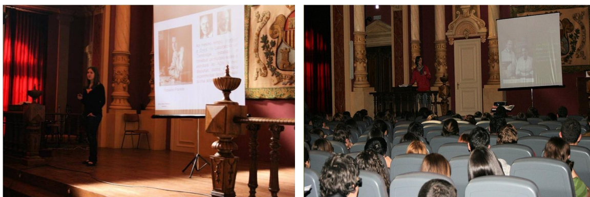
Figura 9. Presentación Rosalind Franklin y de Lise Meitner.