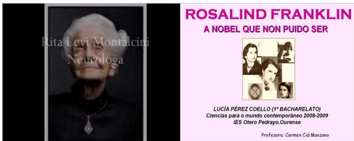
Figura 6. R. Levi Montalcini y Rosalind Franklin.

En el caso de Lynn Margulis se incluye a mayores una dedicatoria para el alumnado del IES Otero Pedrayo, lo que impresionó muchos a los estudiantes durante la presentación pública.