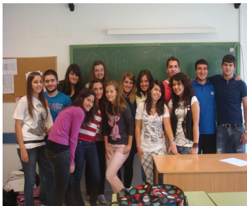
Figura 1. Alumnado de 1º de Bachillerato que realizó el trabajo.