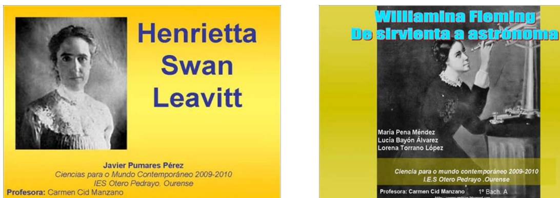
Figura 3. H. Swan Leavitt y W.Fleming.