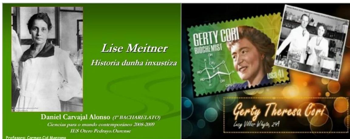
Figura 7. Lise Meitner y Gerty Cori.

La presentación oral de las tareas se realizó en horario lectivo a todo el grupo-clase. Las exposiciones estuvieron seguidas de breves coloquios moderados por la profesora. Una vez que se presentó cada trabajo se incluyó en el canal de Youtube llamado "iesotero" y las presentaciones a la página web del departamento de Biología e Geología en el apartado multimedia: