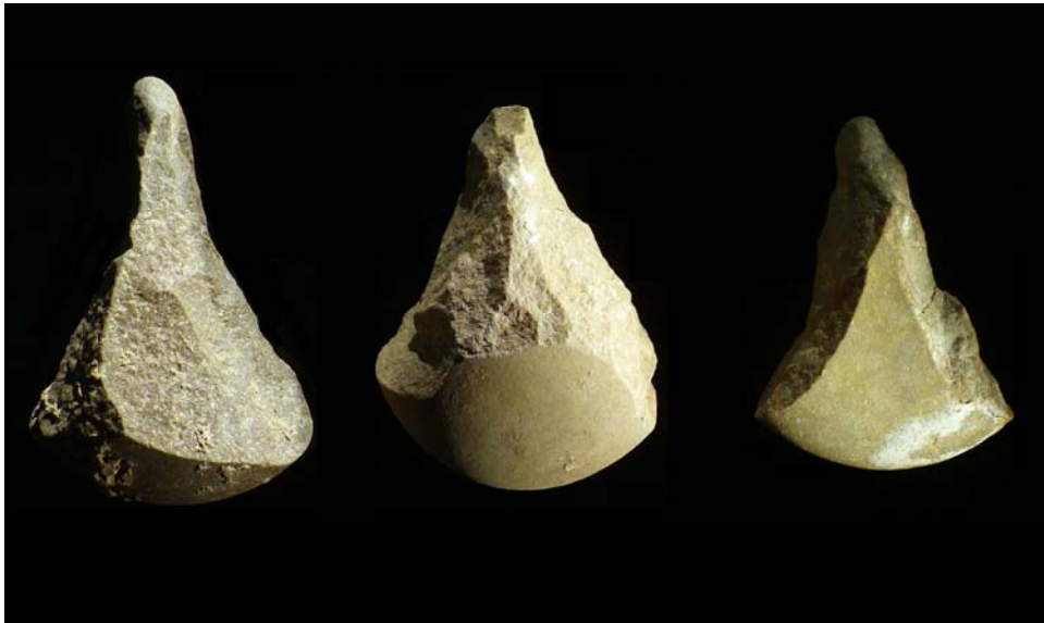
Figura 1. Picos asturienses procedentes de Mazaculos II.

A principios del siglo XX, a los eruditos locales, como el Padre Sierra o Alcalde del Río, se van a unir una serie de investigadores procedentes de otros países, y juntos van a dinamizar la investigación arqueológica en la región. Comienza así una larga tradición de investigadores extranjeros trabajando en el Cantábrico, dominada en estos primeros momentos por la escuela francesa (Straus y Clark, 1978:292), a través del Instituto de Paleontología Humana de París, creado por el Príncipe Alberto I de Mónaco. Entre estos investigadores extranjeros destacan las figuras de Breuil, Harlé y Obermaier.