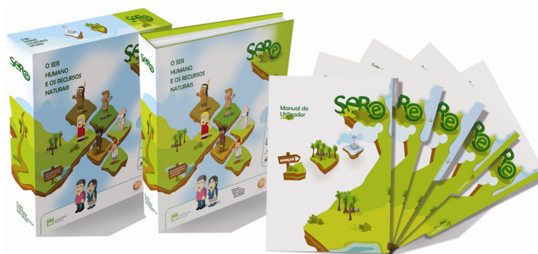
Figura 5.- Guiões de Exploração Didáctica.

No Guião de Exploração Didáctica - Professor propõem-se diferentes actividades, estruturadas da seguinte forma: i) Finalidades da Actividade; ii) Contexto de Exploração; iii) Metodologia de Exploração. Os guiões destinados aos/às alunos(as) são compostos fundamentalmente por folhas de registos.