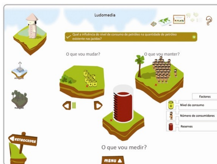
Figura 7. – Ecrã da actividade 4 da Fase I - O que influencia a quantidade de petróleo existente nas jazidas?

A simulação da situação (figura 7) permite o estabelecimento da relação entre o número actual de pessoas que consome petróleo, generalizando os níveis de consumo dos países desenvolvidos, e a quantidade de petróleo que ainda resta. A análise do cenário considerado evidencia que as reservas do petróleo se esgotarão, sem possibilidade de reposição. A finalidade última desta fase do Courseware Sere é que os alunos compreendam que o petróleo é um recurso natural que é não renovável considerando a escala temporal humana.