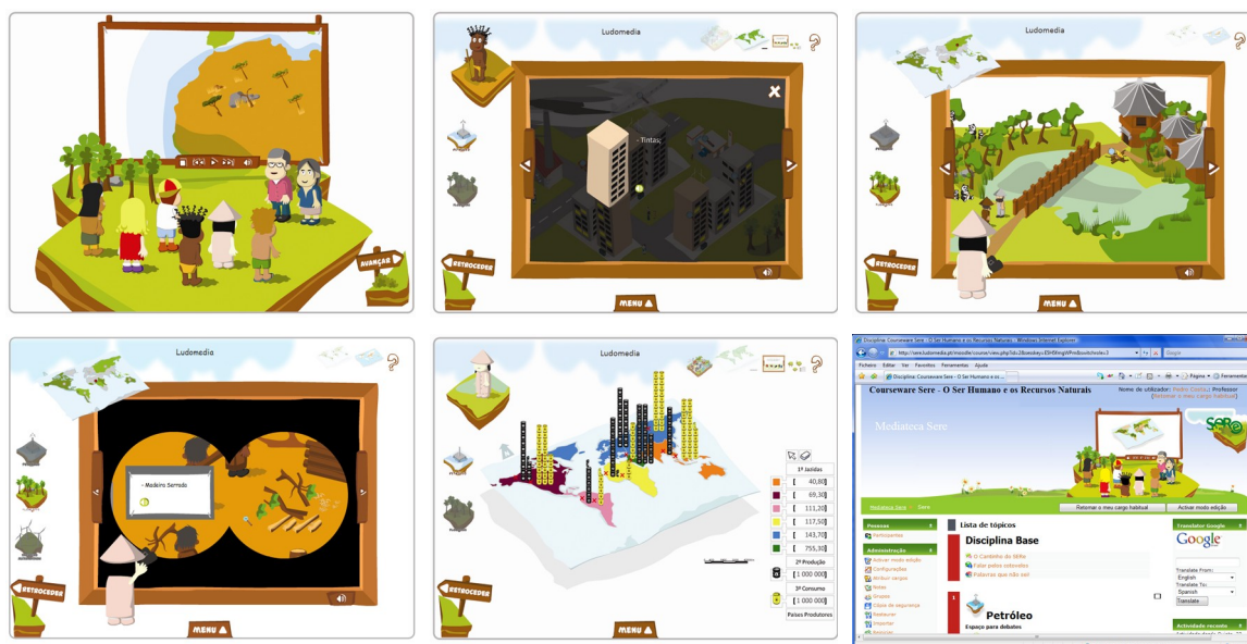
Figura 2.- Exemplos de ecrãs do Courseware Ser e .

fazem parte: um software educativo (versão em CD-ROM e online , ver versão demo em http://sere.ludomedia.pt/ ), os Guiões de Exploração Didáctica para o Professor, os Guiões de Registo para o Aluno/Utilizador e o Manual do Utilizador. A versão do software online possibilita o acesso a outros recursos, como por exemplo uma mediateca criada pela equipa para disponibilizar o acesso a documentos sobre as temáticas a explorar. No Manual do Utilizador encontram-se informações relacionadas com a navegação nos ecrãs e os ícones utilizados no software (figura 2).