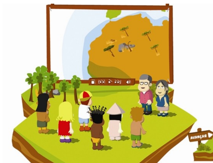
Figura 4. – Personagens utilizadas no recurso (os exploradores de costas e os coordenadores de frente).

Para conduzir esta pesquisa e orientar o estabelecimento de relações e interações entre a população e o uso dos recursos foram criadas 8 personagens - seis exploradores e 2 coordenadores da equipa (figura 4) – que podem desempenhar papéis diferentes ao longo do desenrolar de toda a situação, nomeadamente acompanhar cada um dos grupos de exploradores ao longo das várias actividades.