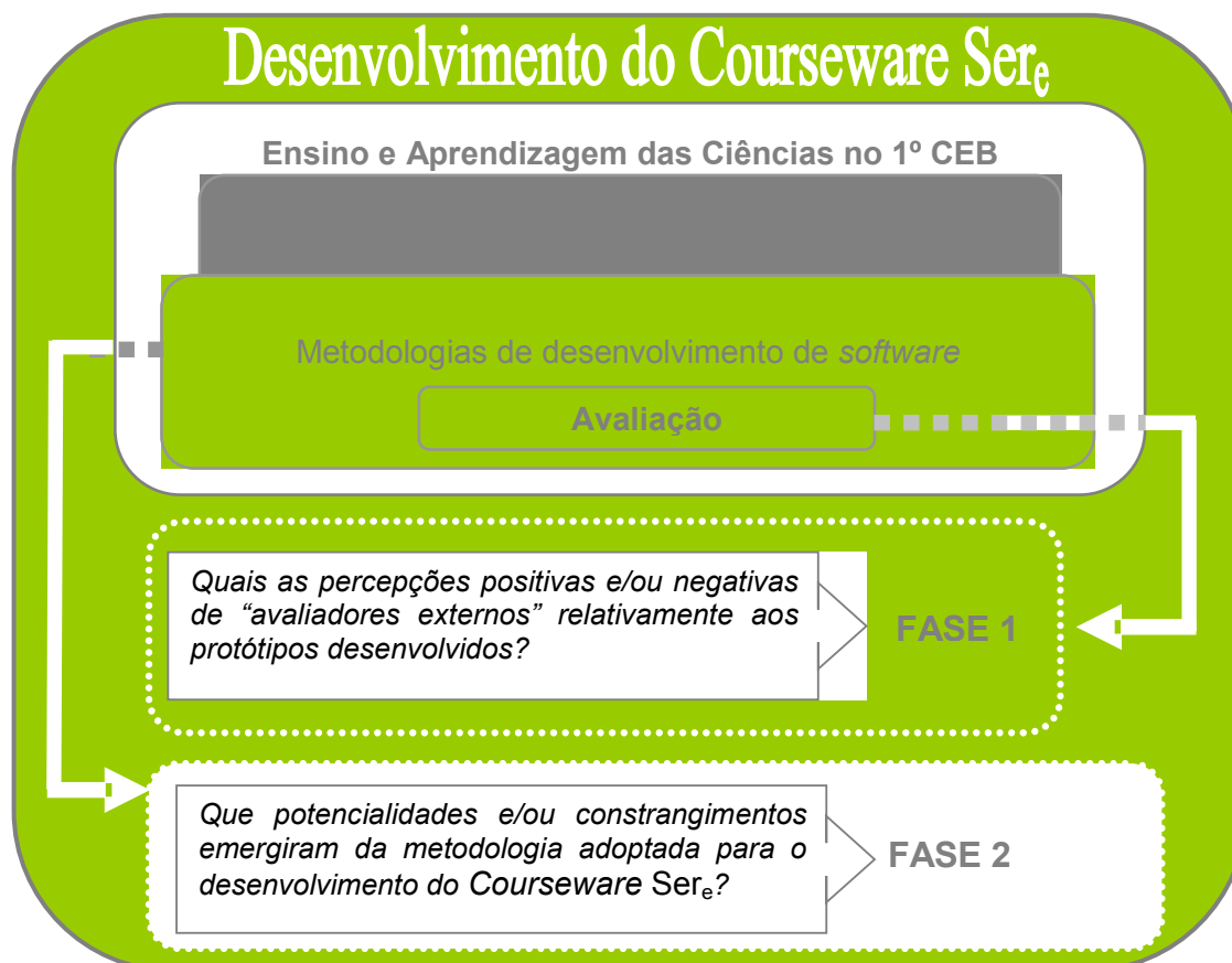
Figura 1.- Esquema conceptual do estudo (adaptado de Guerra, 2007).

avaliação dos protótipos do Courseware Ser e . Assim, considera-se que o estudo efectuado contribuiu para a melhoria, por um lado, dos protótipos e, por outro, da estratégia de desenvolvimento do Courseware Ser e , prévia à etapa de concepção tecnológica (Guerra, 2007).