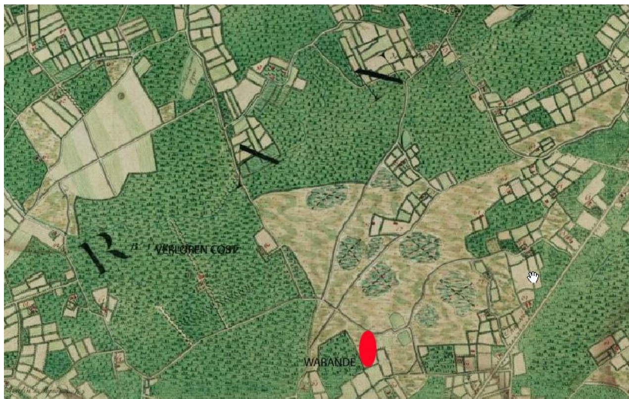
Figuur 2: Fragment van de Ferrariskaart. De onderzoekszone bevindt zich onder de rode ovaal. (Joseph de Ferraris (1771 en 1778), via website van de KBR 4 .)