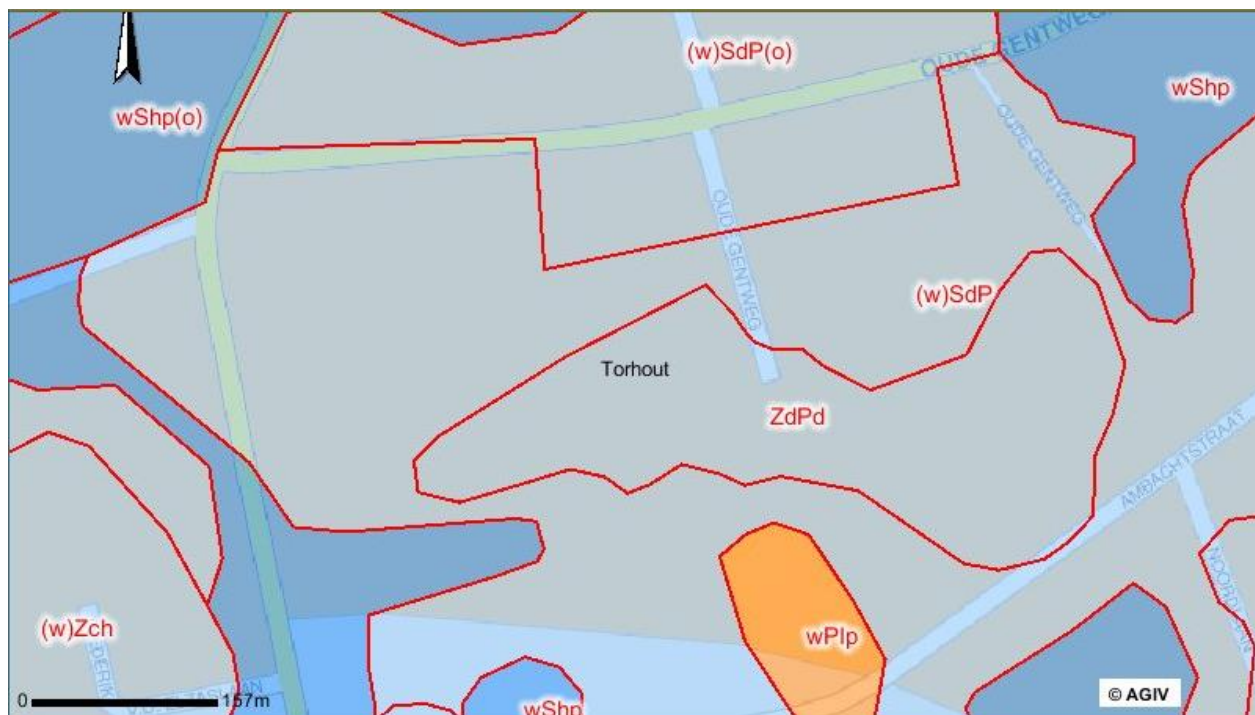
Figuur 3: Bodemkaart van de omgeving van het projectgebied. (Agiv 5 )

Het projectgebied is gelegen in zandig Binnen-Vlaanderen. Op de plaats van het onderzoek bestaat de bodem uit zand of lemig zand. Deze gronden zijn matig nat en kennen een sterk antropogene invloed.