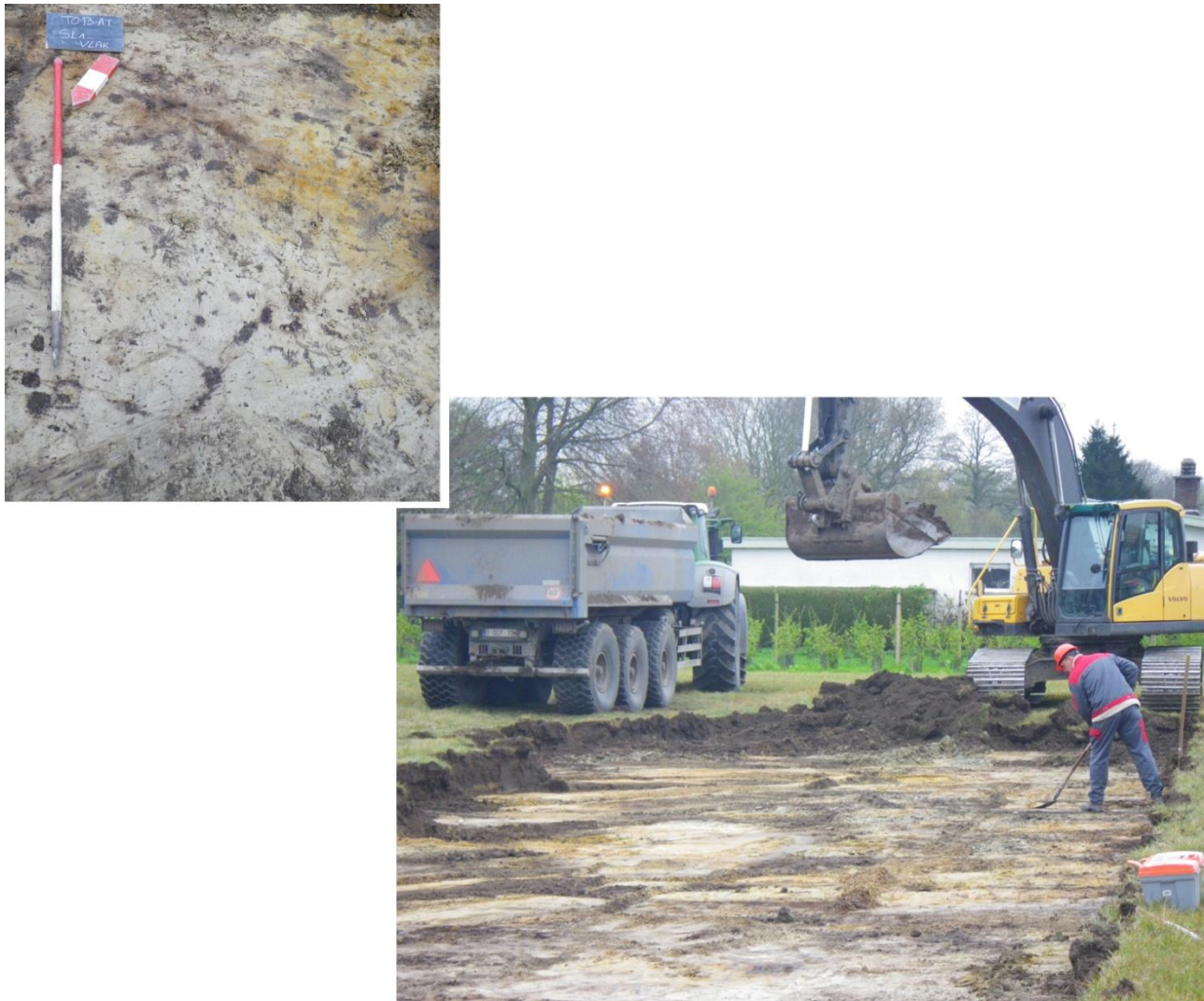
Figuur 4: Detailfoto van het vlak en een sfeerfoto van de graafwerken.

Het grondplan van deze werfbegeleiding is terug te vinden in de bijlage.