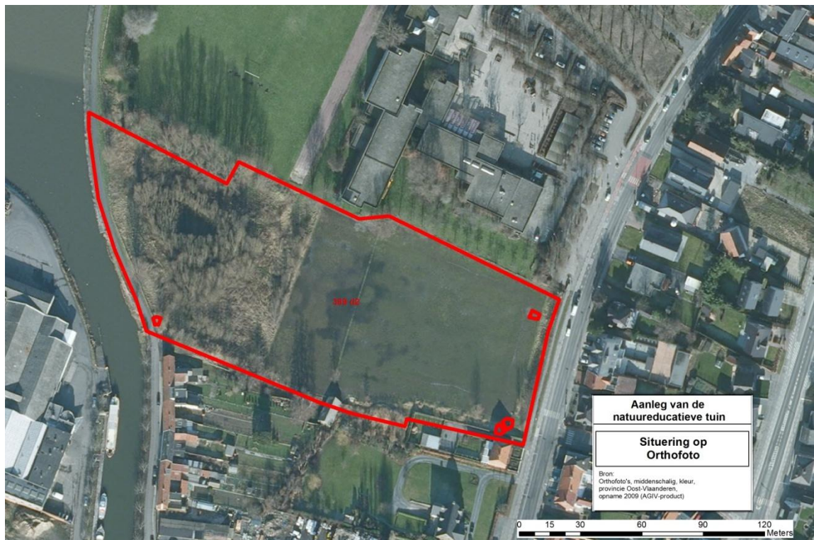
fig. 3: Situering van het projectgebied op de kleuren orthofoto