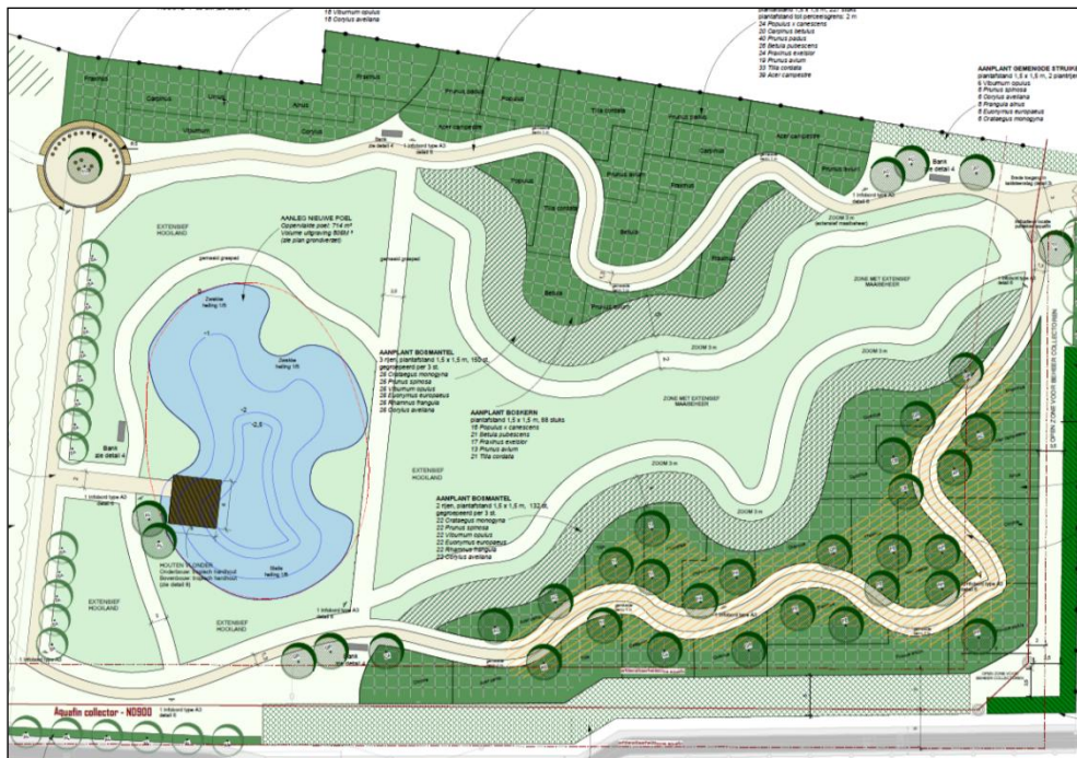
fig.2: Het ontwerp van de natuureducatieve tuin

In het kader van deze doelstelling worden volgende maatregelen gerealiseerd: aanleg van een nieuwe poel met vlonder, aanleg halfverhard wandelpad, aanplant van bosgoed, hagen en hoogstambomen, inzaaien extensief hooiland, plaatsen van zitbanken en infoborden en het plaatsen van een afsluiting en een toegangspoort.