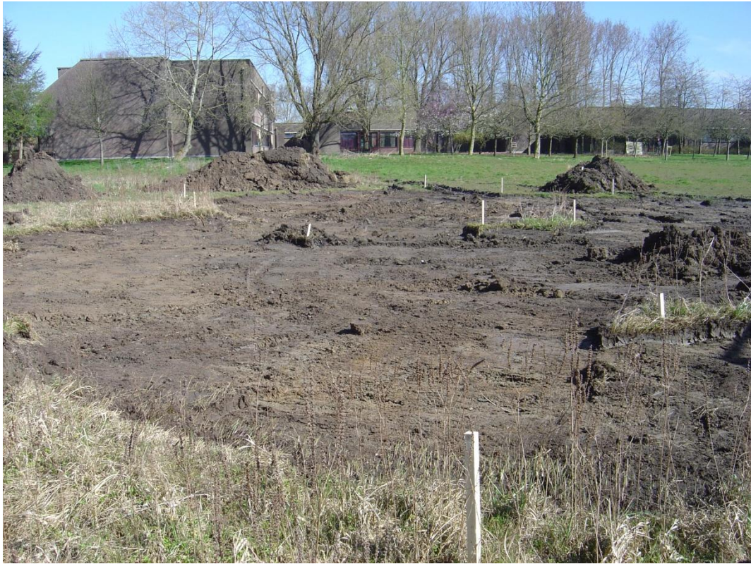
fig. 4: Overzichtsfoto van de poel na het afgraven van de teelaarde