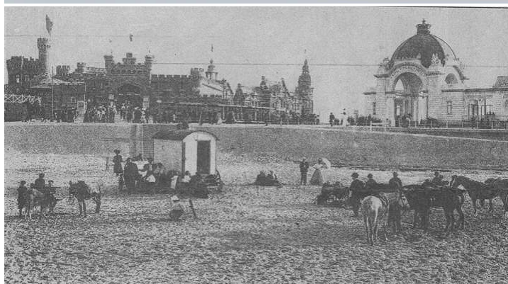
Wellington hippodroom en Royal palace hotel