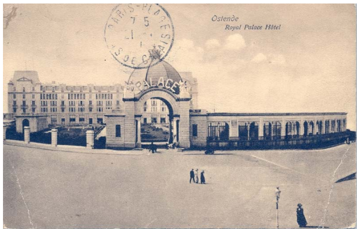
Royal palace hotel

Met de bouw van het 'Royal Palace' hotel werd op het einde van de 19 de eeuw van start gegaan.