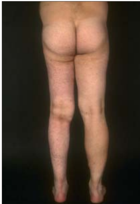
Figuur 3. Patiënt 2: asymmetrische contour ten gevolge van zwelling van veneus en lymfatisch weefsel.

Er is geen curatieve therapie voor Klippel-Trenaunay-syndroom. Omdat het diepe veneuze systeem vaak onvoldoende is aangelegd en vanwege de kans op recidief is men doorgaans terughoudend in de behandeling van de vaatanomalieën bij het Klippel-Trenaunay-syndroom. De behandeling is dan ook bij voorkeur conser-