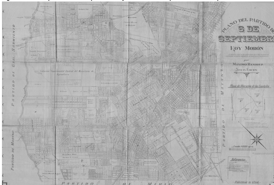
Figura 1: Plano del partido de 6 de septiembre. Hoy Morón. Realizado por Máximo Randrup. 1940. Escala 1: 13.333