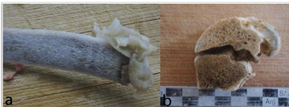
Figura 2: a) variaciones de los tejidos luego del proceso de hervido; b) desarticulación luego del hervido.

Después del hervido, también fue posible registrar una serie de variaciones cualitativas. Entre ellas, notamos un cambio de coloración y textura. En la mayoría de los casos, los huesos hervidos se vuelven más blancos y porosos, siendo estos cambios más evidentes en las costillas (Figura 2). Asimismo, notamos que el hervido aumenta la desarticulación de elementos ya que fue posible registrar la separación de las epífisis en los elementos que no se encontraban completamente fusionados (Figura 2). Por otra parte, es notable la pérdida de oleosidad, que caracteriza la superficie de los huesos frescos, luego del hervido de los mismos.