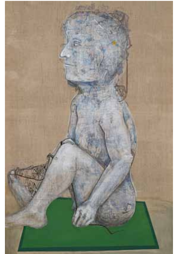
Figura IV. Técnica mixta sobre lino 2013 167 x 895 cm.

siones– se niegan a darles sus documentos y a quienes les repiten con insistencia “para qué buscas, si tus padres [de crianza] te dieron todo y, además, ¡ya sos grande!”. Frente a una constelación de circunstancias, sujetos y prácticas políticas que des-