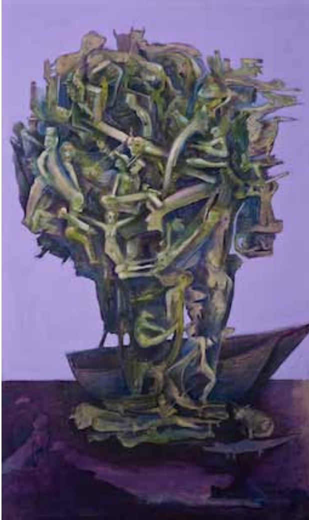
Caronte Acrílico sobre lino, 2012 144 x 85 cm.

vínculos. Por lo tanto, en esos contextos, la información sobre los orígenes fisiológicos aporta un conocimiento de interés secundario. En nuestras sociedades, en cambio, debido a la centralidad dada al momento del coito, a la procreación sexuada, toda información relativa a la concepción provoca una perturbación inmediata en las relaciones y en la identidad de los individuos porque ese tipo de conocimiento está ligado a la idea de la "identidad personal".