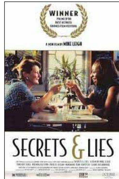
Secretos y Mentiras Dirigida por Mike Leigh Reino Unido, 1996