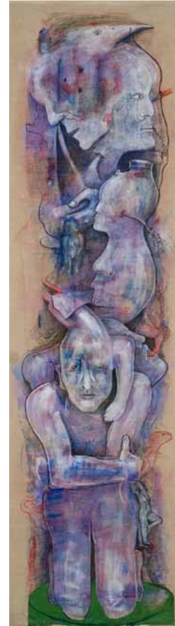
Entonces vi... I Técnica mixta sobre lino, 2014 190 x 56cm.

Preguntarse a uno mismo por el origen suele ser difícil, sobre todo si existen dudas sobre la relación biológica que nos une con nuestros padres, pero resulta aún más complejo preguntar a los padres por el propio origen. Ciertamente, muchas de estas personas que aún hoy buscan sus orígenes no han