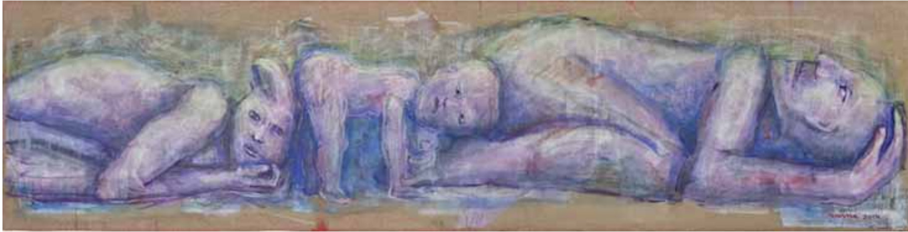
Familia II Técnica mixta sobre lino 2014

animan estas búsquedas, estas personas quieren conocer sus orígenes biológicos y se organizan demandando que el Estado les garantice su derecho a la identidad.