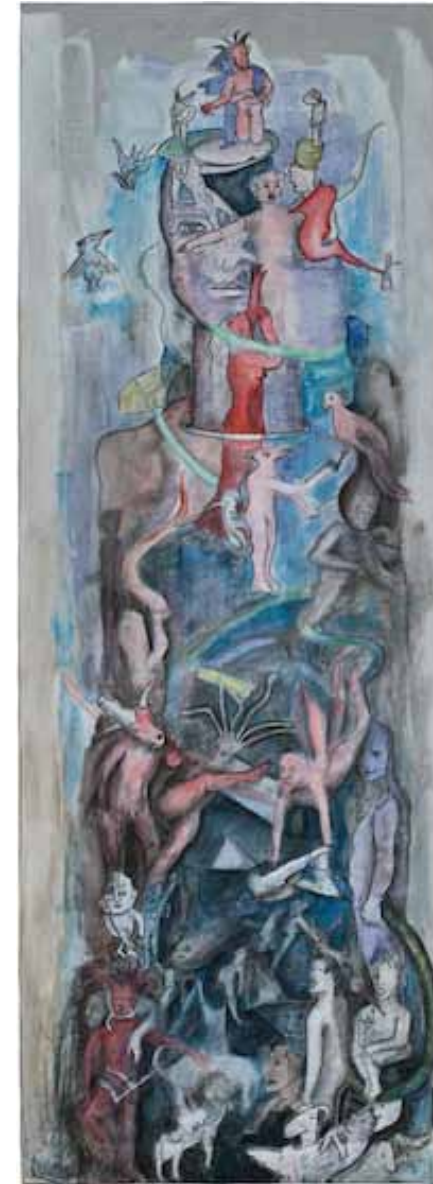
Entonces vi... III. Técnica mixta sobre lino, 2015 136 x 47,5cm.