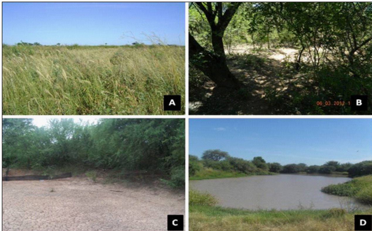
Figura 2. Ambientes muestreados en las áreas naturales Caburé Sur y Parque Provincial Copo en Santiago del Estero, Argentina. A) Pastizales (paleocauces), B) bosques secundarios, C) lagunas temporales, y D) lagunas permanentes.

Committee, 2013). Posteriormente, fueron fijados con formol al 10% y conservados en alcohol al 70%. Los especímenes de anfibios fueron depositados en la Colección Herpetológica del Museo de La Plata; y los reptiles en la Colección Herpetológica de la Universidad de San Luis (Apéndice I). Se realizaron registros fotográficos para aquellos casos que la colecta de especímenes de referencia no fue posible.