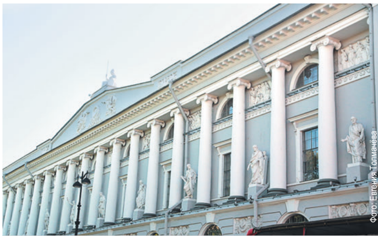
Императорская публичная библиотека Санкт-Петербурга, фото 2018 года