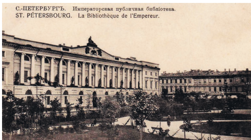
Императорская публичная библиотека Санкт-Петербурга, фото конца XIX-начала XX века