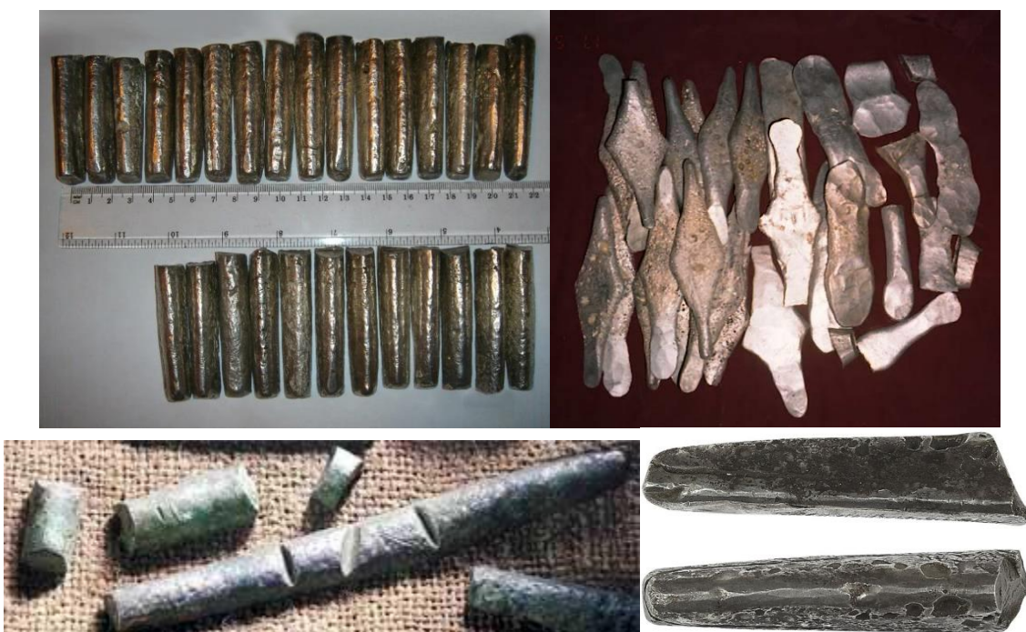
Фото 14. Гривні та рубані їх частини

здійснення дрібніших, хоча вартісних розрахунків. І таким чином рублі стали більш поширеними в обігу, й послужили назвою для нової валюти.