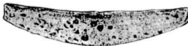
Фото 11. Гривня татарського типу. Срібло, XIV ст.

Крім названих вище, на території України було знайдено човноподібні гривні з поздовжнім нарізом, які дістали назву татарських (фото 11). За вагою вони відповідають новгородським, але датуються лише XIV ст. Учені вважають, що вони використовувалися для розрахунків із Ордою та монголо-татарами.