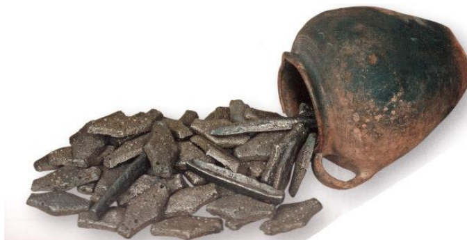
Фото 13. Скарб срібних грошових гривень XII-XIII ст. з Михайлівського золотоверхого монастиря

Поширення гривень, так само як і їхнє зникнення, прямо пов'язане з історичними подіями. Економічна криза в Київській Русі, що почалася із другої половини XIII ст. у зв'язку з монголо-татарською навалою, зачепила і гривню. 1237 р. в межі Русі вторглося 140-тисячне військо внука Чингізхана, Батия. Київ же був узятий монголами взимку 1240 р. Гривні поступово виходять з обігу. «Київська» гривня зникла з ужитку ще раніше, на початку XIII ст.; «новгородська» – в XV ст. «Другого життя» давньоруські гривні набувають уже як історичні знахідки археологів. За свідченням фахівців, Київ був одним із найбільших центрів зосередження монетних гривень: тут знайдено 1/3 від загальної кількості виявлених археологами давньоруських злитків, вага яких становить близько 130 кг (фото 13) [5].