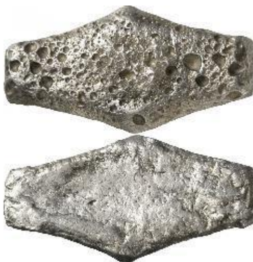
Фото 8. Гривня київського типу. Срібло, X-XIII ст.

Найбільш рання – «київська» (фото 8), шестикутної довгастої форми і вагою майже 140-160 г срібла, з'явилася в XI ст. Ці гривні були економічним символом Києва і були в ужитку до монголо-татарського нашестя в XIII ст. Названі так за місцем їхнього виготовлення. Дослідники вважають, що вага гривень київського типу була пов'язана з візантійською вагою одиницею літрою (327,5 г) і становила її половину. Київські гривні були найбільш поширеними на території Південної та Південно-Західної Русі [11].