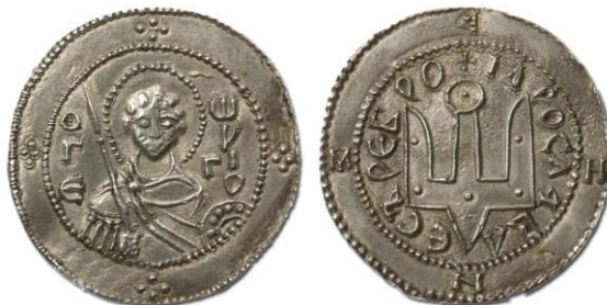
Фото 4. Срібляники часів Ярослава Мудрого, X ст.

Срібляники Ярослава Мудрого відрізнялися зовнішнім виглядом. На одній стороні замість зображення Христа чи князя було зображення св. Юрія (християнського покровителя Ярослава), на іншій – родовий знак-тризуб і легенда «Ярославле сребро». Всі дослідники відзначають високий мистецький рівень виконання монет Ярослава Мудрого.