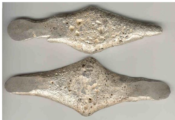
Фото 10. Гривня чернігівського типу. Срібло, кін. XI-XIII ст.

Чернігівська гривня за формою (ромбоподібні з розплющеними краями) була дуже близькою до київської, а за вагою – до новгородської (фото 10). Названі так за місцем їх знахідок. Деякі з чернігівських гривень важили 204 г, що уможливорює висновок про їх відповідність новгородським. Останні знахідки чернігівських гривень свідчать про те, що більшість із них важили близько 197 г, що відповідало скандинавській марці. Їх виробництво почалося наприкінці XI – на початку XII ст., а обіг тривав до другої половини XIII ст.