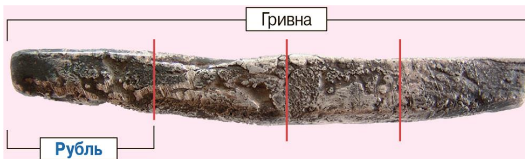
Фото 15. Поділ гривні на частини – рублі.

Отож, слово „рубель” чи „рубль” з’являється як назва половини гривні або коротшої її частини (фото 15).