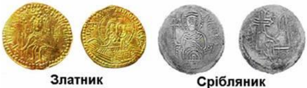
Фото 2. Перші давньоруські монети (златники і срібляники)

Перші давньоруські монети (златники і срібляники) фото 2, 3, 4) з'явилися за часів Володимира Великого та Ярослава Мудрого, і карбувалися всього близько 25-35 років [5].