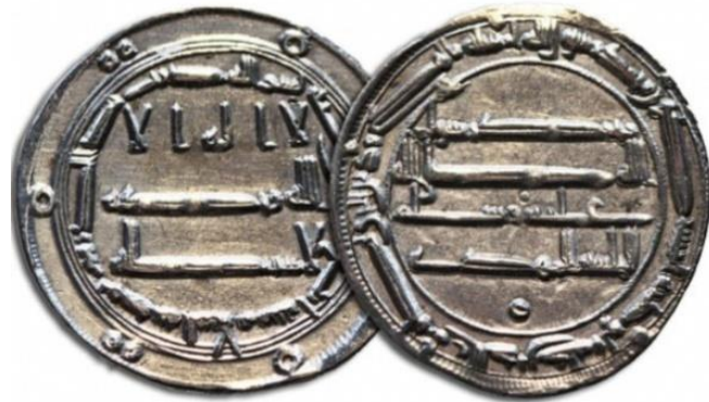
Фото 1. Арабські дирхеми, VIII-X ст., срібло

арабськими срібними дирхемами (фото 1) , що з'явилися на давньоруській території внаслідок торгівлі з Арабським Халіфатом. Руські купці, які торгували на Сході хутрами, воском і челяддю (рабами), привозили додому дирхеми, які у великій кількості археологи знаходять у похованнях та скарбах.