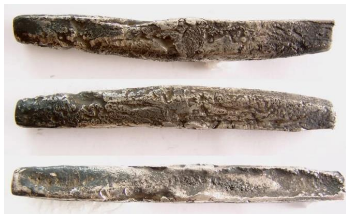
Фото 9. Гривня новгородського типу. Срібло, XII-XV ст.

Чернігівська гривня за формою (ромбоподібні з розплющеними краями) була дуже близькою до київської, а за вагою – до новгородської (фото 10). Названі так за місцем їх знахідок. Деякі з чернігівських гривень важили 204 г, що уможливорює висновок про їх відповідність новгородським. Останні знахідки чернігівських гривень свідчать про те, що більшість із них важили близько 197 г, що відповідало скандинавській марці. Їх виробництво почалося наприкінці XI – на початку XII ст., а обіг тривав до другої половини XIII ст.