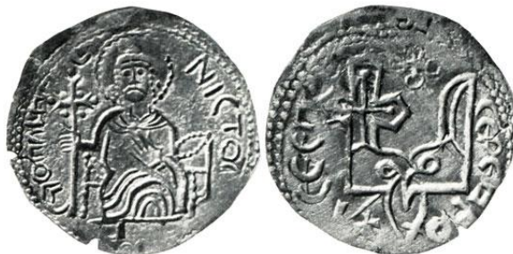
Фото 5. Срібляники часів Святополка, X ст.

Срібляники Святополка стали останніми давньоруськими монетами у класичному розумінні (фото 5).