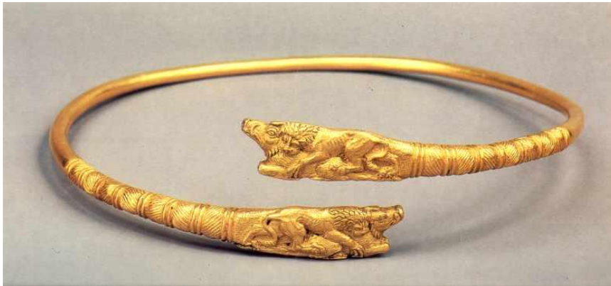
Фото 6. Гривна, прикрашена кільцевими поясами, зі скульптурними сценами (лев терзає кабана) на обох кінцях. Греко-скіфський стиль, кін. IV ст. до н.е. [8]

Гривня лічильна – означала певну кількість срібних монет, гривня вагова – означала точну вагу срібла або золота. Сам термін « гривня » походить від слова «грива» (загриво, шия) – прикраси з золота або срібла у вигляді обруча, що носили знатні люди на ший (на «загривку») (фото 6, 7) [7].