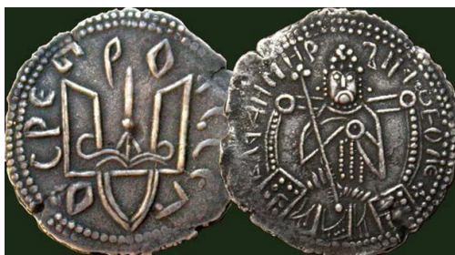
Фото 3. Срібляники часів Володимира Великого, X-XI ст.

Златник Володимира Великого мав вагу 4,4 г, срібляник – довільну вагу – від 1,73 до 4,68 г.