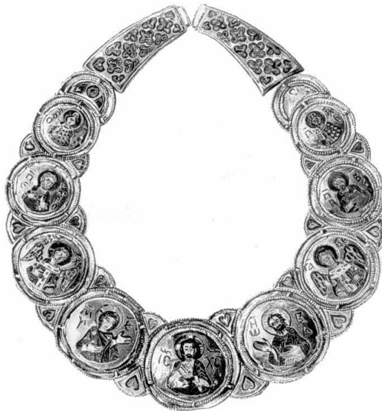
Фото 7. Золота гривна з емалевими зображеннями з с. Кам'яний Брід на Житомирщині. XII – XIII ст. [9].

Київські майстри-ювеліри робили «шийні гривни» із золота і срібла. Однак, хоча гривна видається жіночою прикрасою, носили її і чоловіки: князь і дружина – як символ влади. «Шийну гривню» знайдено як у похованнях, так і в скарбах, разом з іншими прикрасами – браслетами та сережками.