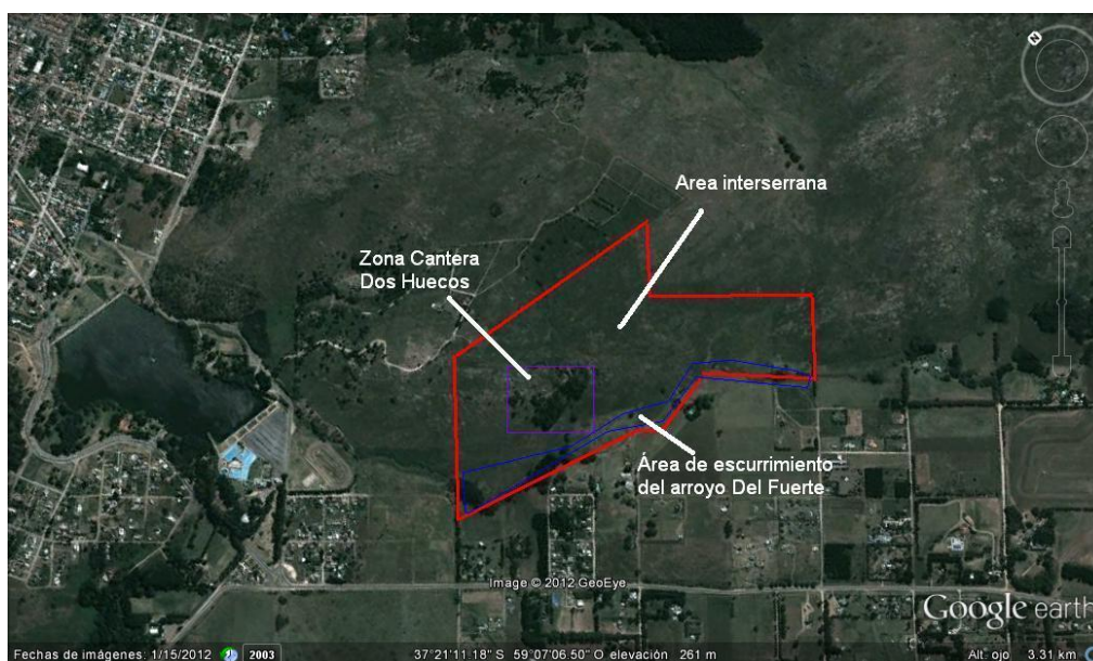
Figura Nº 3: Delimitación de unidades ambientales síntesis