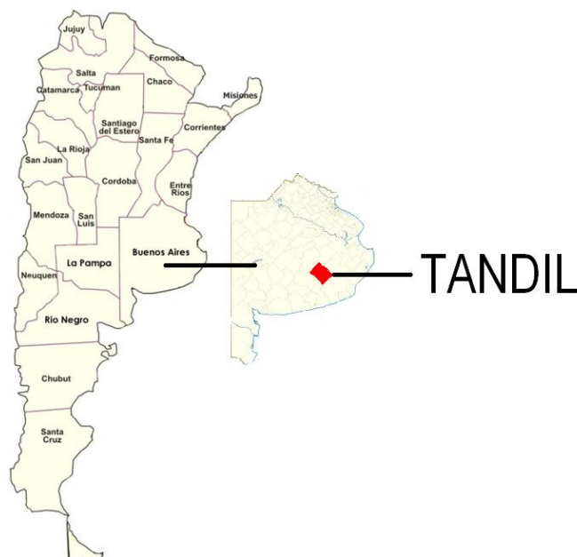
Mapa 1: Localización de Tandil en Argentina

El Partido de Tandil está emplazado en la pampa húmeda y más precisamente, en el sistema serrano de Tandilia, que lo atraviesa en sentido NO-SE.