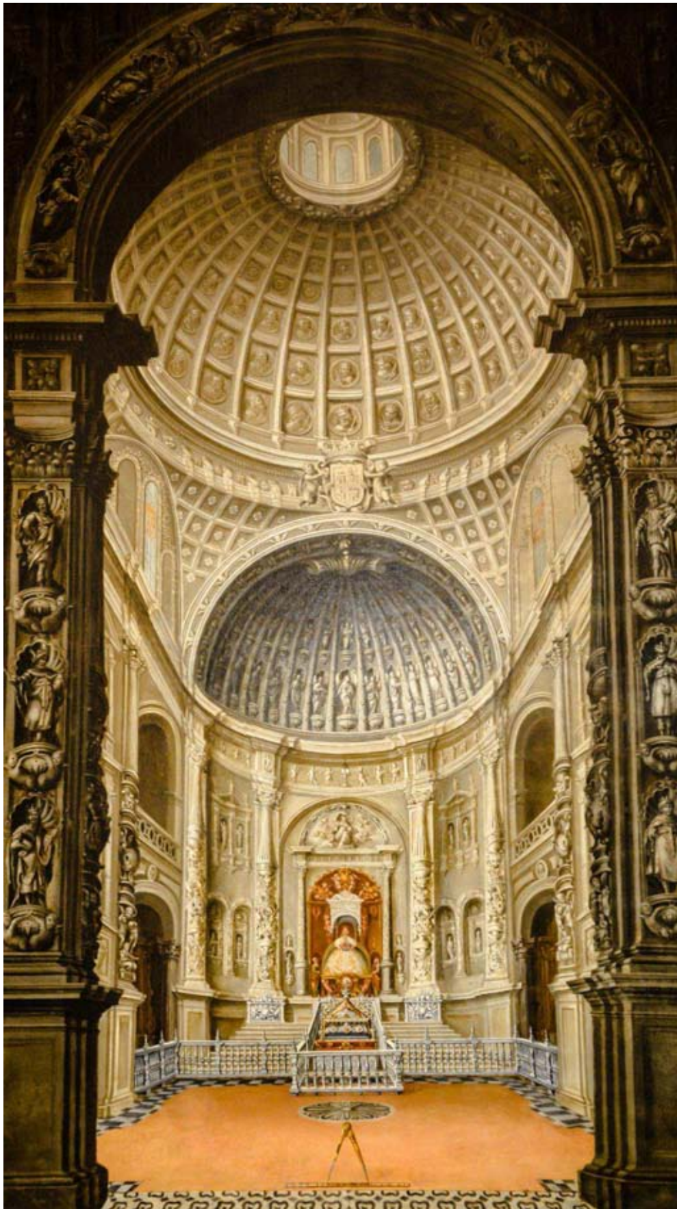
Ilus. 2. Capilla Real de Sevilla. Domingo Martínez. 1730. Museo Catedral de Sevilla.