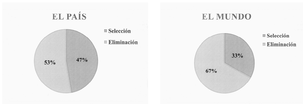
Gráficos 1 y 2: porcentajes de documentos eliminados: 1 ( El País ); 2 ( El Mundo )

A la luz de los resultados, podríamos cuestionarnos si la tabla de valoración que proponemos no es demasiado exigente con los documentos fotoperiodísticos. Ciertamente es que, a simple vista, cualquier documento fotoperiodístico tiene valor para ser salvaguardado en el archivo fotográfico del medio. En otras palabras, siempre alguien puede esgrimir un motivo (o criterio) para defender la conservación de una determinada fotografía. Por ello, resulta tan primordial el hecho de que la selección no se apoye en un solo criterio selectivo, sino que sea la evaluación conjunta de varios criterios la que delimite la importancia y el interés de una fotografía para los archivos de la empresa periodística. En otras palabras, diversos juicios pueden asegurar una selección documental más congruente. Jugar con un solo criterio selectivo es tanto como dejar al selector documental solo con su experiencia e intuición, lo que no siempre resulta efectivo y apropiado.