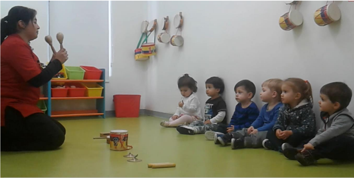
Imagen No. 3 Trabajo de interacción con niños