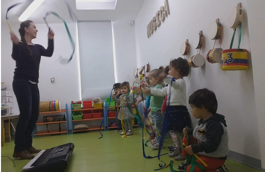
Imagen 1. Clase con los niños