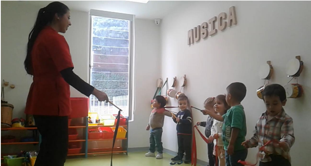
Imagen No. 4 Relación y aprendizaje en el aula