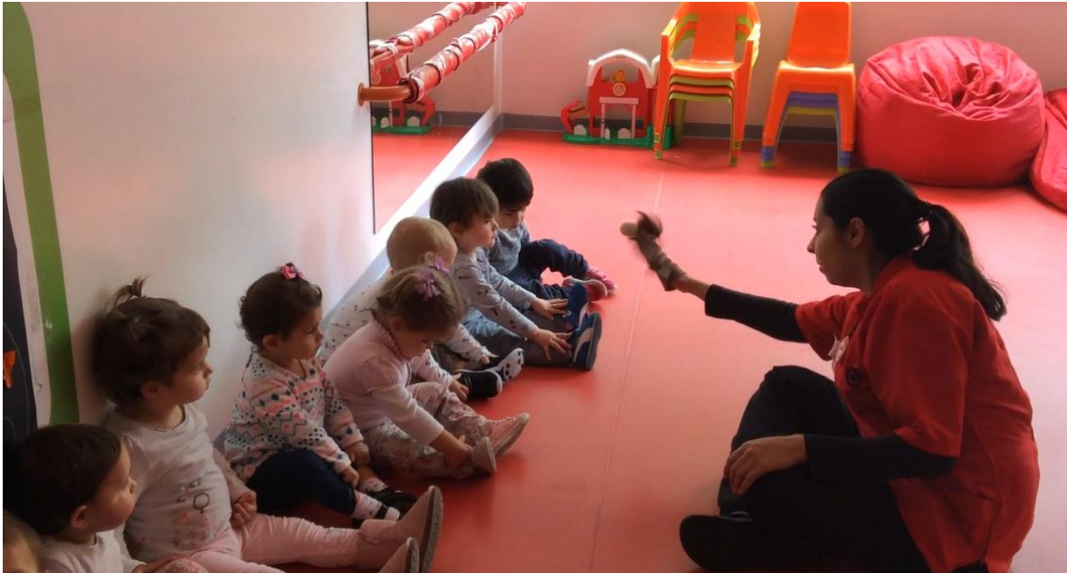
Imagen No. 2 Relación entre maestra y niños

realizadas, dado que se trabajan de manera transversal durante cada sesión, haciendo mayor énfasis en alguno.