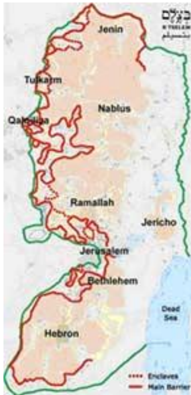
Imagen 2 Mapa muro-valla