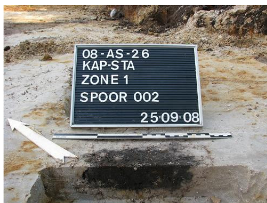
Afbeelding 7 Ondiep paalspoor S031

De tweede categorie bestaat uit zes subrecente paalsporen S019, S029, S030, S031, S032 en S033. Het betreft zes ondiep tot zeer ondiepe paalsporen waarbij S029, S030 en S031 een cluster vormen alsook S032 en S033; S019 ligt eerder geïsoleerd. Overwegend hebben ze een donker grijze kleur met licht grijze en bruine vlekken (cfr. Afbeelding 7). Er werd geen vondstmateriaal aangetroffen waardoor een datering uitblijft.