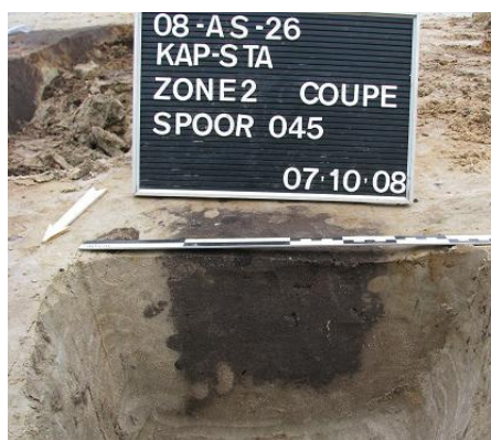
Afbeelding 17 Paalspoor S045