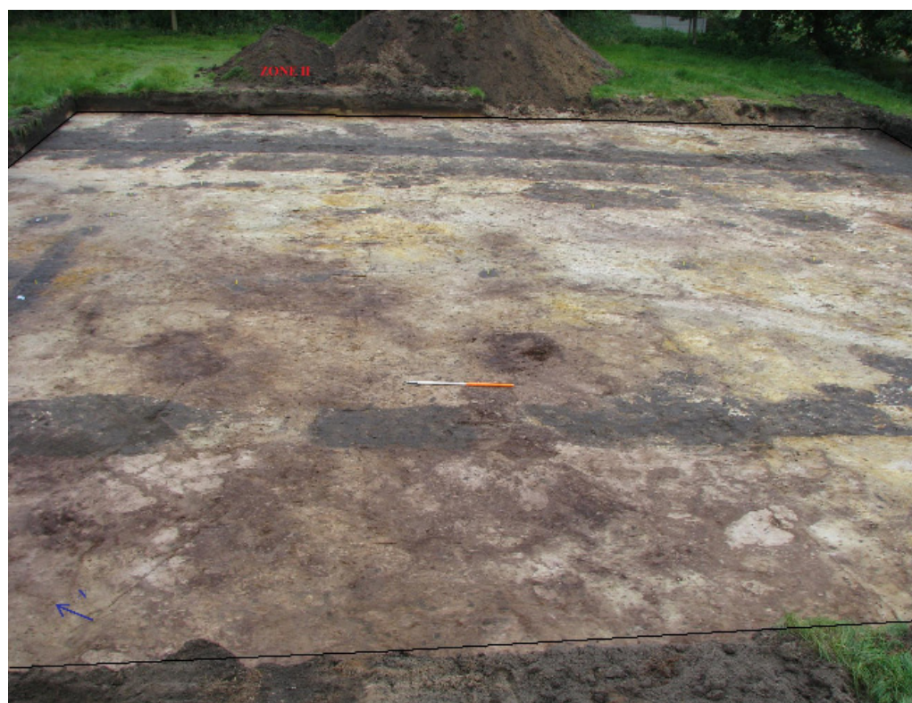
Afbeelding 13 Overzichtsfoto ZONE II

Bij het metaaldetectieonderzoek werden op de zandbergen één munt van Leopold II (1865-1909) en een militaire knoop ('Genie Maritime') teruggevonden (cfr. Bijlage 2: Vondstenlijst Zone II nr.: 33).