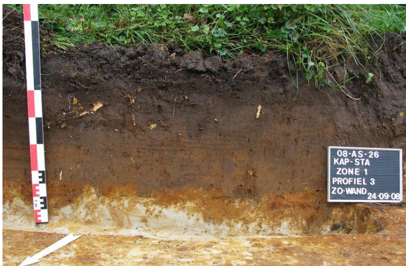
Afbeelding 4 Profiel 3 (ZO-wand) ZONE I