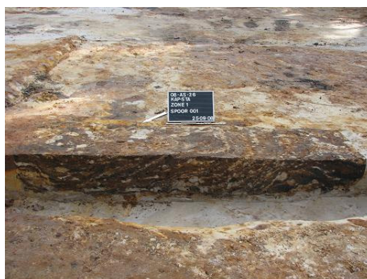
Afbeelding 9 Rechthoekige kuil S001

S001 is een rechthoekige kuil (210 x 90 cm) met een vlakbodem waarbij één 19de eeuwse rood geglaazuurde aardewerkscherf werd aangetroffen (cfr. Bijlage 2: Vondstenlijst Zone I nr.:1). De kuil heeft een zeer vlekkerig kleurenpatroon bestaande uit hoofdzakelijk zwarte alsook licht bruine tot bruine en licht grijswitte vlekken (cfr. Afbeelding 9).