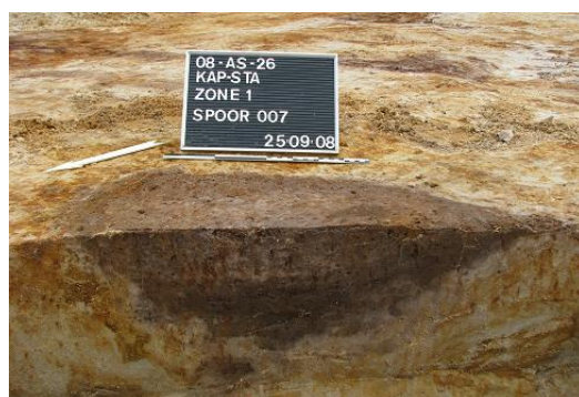
Afbeelding 10 Komvormige kuil (?) S007