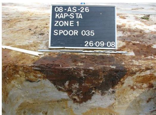
Afbeelding 6 Paalspoor S035

S035 (cfr. Afbeelding 6). Ze staan niet in verband met elkaar en zijn van een eerder recente 19 de eeuwse oorsprong. Deze datering kon gegeven worden aangezien er bij een kuil (S001) met een gelijkaardige vulling een 19 de eeuwse rood geglazuurde scherf werd teruggevonden.