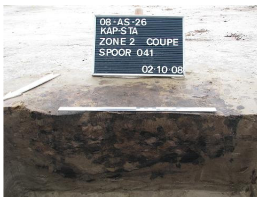
Afbeelding 15 Kuil S041

materiaal kunnen ze allen als gelijktijdig beschouwd worden. Bij kuil S043 werden twee scherven, een deel van het handvat en een wandfragment, teruggevonden van een vuurklok in grijs aardewerk (cfr. Bijlage 2: Vondstenlijst Zone II nr.: 24).