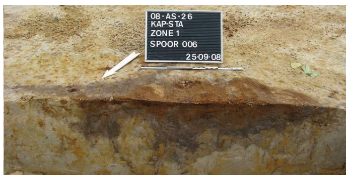
Afbeelding 12 Natuurlijk spoor S006

Naast deze boomvallen werden een groot aantal natuurlijke sporen aangetroffen. Het betreft de volgende sporen: S003-S006, S008-S009, S012-S017, S022-S023, S027-S028, S034 en S036. Ze hebben een donker grijze kleur met licht grijze vlekken alsook bruine vlekken afkomstig van ijzerconcreties (cfr. Afbeelding 12).