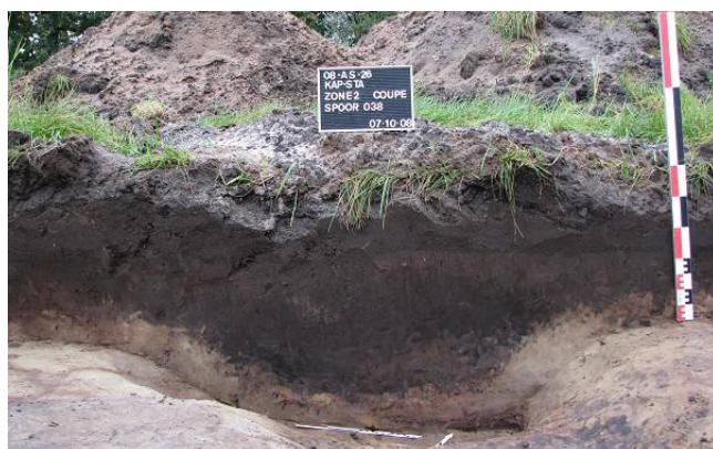
Afbeelding 16 Gracht S038 (NW-Profielwand) met onderaan rechts het donker bruine veenlaagje

Het smalle ondiepe greppeltje (S040), met een breedte van 40 à 50 cm en een NO - ZW oriëntatie, kon over zijn volledige lengte (7 m) waargenomen worden en vervaagde zowel in noordoostelijke als zuidwestelijke richting. Het greppeltje heeft net als bovenvermelde gracht een zandige vulling met een zwarte - donker grijze kleur. Het materiaal bestond ook hier uit een drietal fragmenten van lokaal grijs aardewerk eveneens te plaatsen in de Late-Middeleeuwen (cfr. Bijlage 2: Vondstenlijst Zone II nr.: 23). Bij het couperen van het greppeltje werd nog een laatmiddeleeuwse kuil aangetroffen echter zonder enig vondstmateriaal.