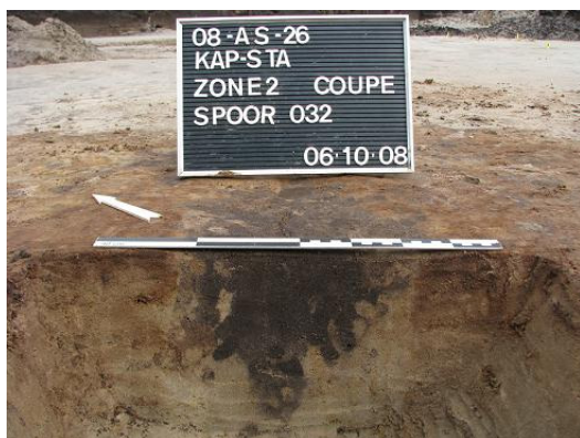
Afbeelding 14 Paalspoor S032

Op het terrein werden een tiental paalsporen (S017, S020, S021, S023, S029, S031, S032, S042, S050 en S063) aangetroffen, echter zonder enig verband met elkaar, maar deel uitmakend van één of meerdere structuren. Over het algemeen hebben ze een zandige vulling met een zwart - donker grijze kleur met licht bruin tot bruine vlekken (cfr. Afbeelding 14). Het beperkte vondstenmateriaal dat bij de paalsporen werd aangetroffen bestaat hoofdzakelijk uit lokale grijs aardewerk scherven alsook enkele vroeg rood geglazuurde scherven (cfr. Bijlage 2: Vondstenlijst Zone II). De paalsporen zijn over het algemeen ondiep tot vrij ondiep bewaard. Van de paalsporen S017 en S029 werden twee zeefstalen (1 x 5 l) genomen en twee pollenmonsters (ook bij paalspoor S031) (cfr. Bijlage 5: Monster- en pollenlijst). Het residu van de twee paalsporen bestaat, naast zandkorrels, uit fragmentaire houtskoolpartikels.