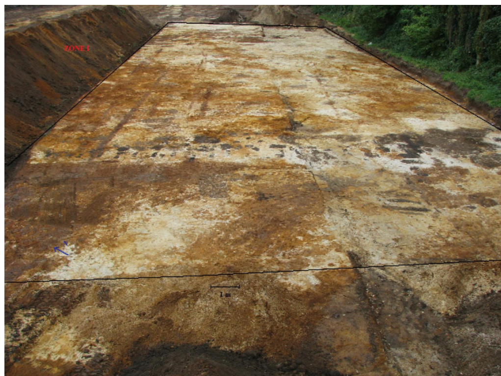
Afbeelding 5 Overzichtsfoto ZONE I

Het vlak heeft een grijs-witte kleur met bruine tot donker bruine vlekken, afkomstig van ijzerconcreties en bestaat uit zwak lemig fijn tot matig grof zand met grindlensjes en kleipropen. Er bevinden zich ook NO-ZW georiënteerde parallelle ijzerbanden (cfr. Afbeelding 5). In totaal werden in Zone I 36 sporen aangetroffen.