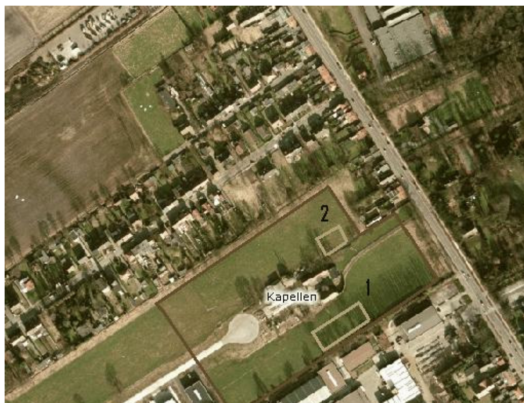
Afbeelding 1 Opgravingsterrein met aanduiding van de twee zones

De aangemaakte georeferende overzichtsplannen zijn opgenomen bij dit rapport, waarbij de plannen de exacte ligging van de opgravingszones met sporaanduidingen weergeven. Tevens werd gezorgd voor de aanduiding van de geplaatste wandprofielen, en de exacte diepteligging van de zones inclusief grondsporen t.o.v. het Oostends Peil: TAW.