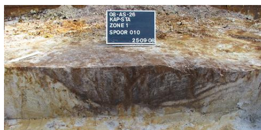
Afbeelding 11 Boomval S010

Op het terrein werden een aantal mogelijke boomvallen teruggevonden. Het gaat om de sporen S010, S011, S018, S021, S024, S025 en S026. Deze sporen hebben overwegend een donker grijze kleur met licht grijze uitlogingsvlekken en donker bruine ijzerbandjes veroorzaakt door waterwerking van de boomwortels (cfr. Afbeelding 11).