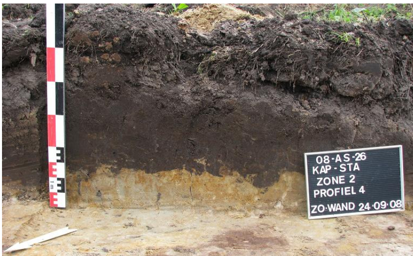
Afbeelding 3 Profiel 4 (ZO-wand) ZONE II

Het terrein, net als Zone I en II, kenmerkte zich voornamelijk door een A - C profielopbouw waarbij een B-horizont afwezig bleek te zijn (cfr. Bijlage 4: Profielen). In het lager gelegen terreingedeelte (zuiden) bevindt zich echter een dunne horizont met een hoge ijzerconcentratie in de top van de C-horizont. Plaatselijk vormen de aanwezige ijzerconcreties een harde oerbank. De A-horizont heeft een donker grijsbruine kleur en bevat recent rood geglazuurd aardewerk. Gemiddeld heeft hij een dikte van 30 tot 40 cm (maximale dikte 70 cm). De C-horizont heeft een grijs-witte kleur met bruine vlekken, afkomstig van ijzerconcreties en bestaat uit zwak lemig fijn tot matig grof zand met grindlensjes en kleipropen (cfr. Afbeelding 3 en 4). Het terrein (maaiveldniveau) bevindt zich gemiddeld 9 m + TAW.