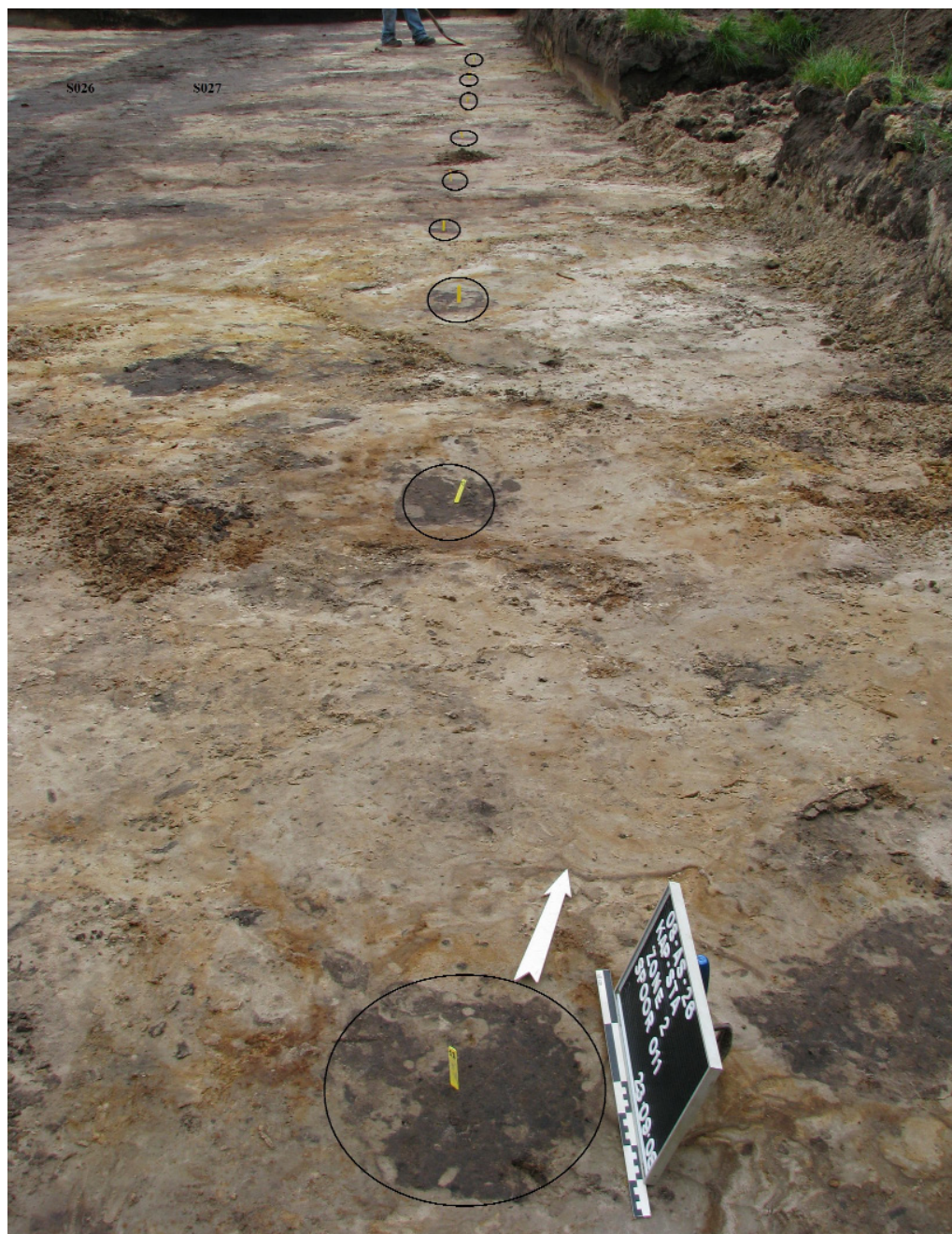
Afbeelding 18 Palenrij (S057 en S058 staan er niet bij) en links de grachten S026 en S027

grens met parallel hiervan een perceelsgracht (S026/S027) (cfr. Afbeelding 18). De kadastrale gegevens (teruggaand en gebaseerd op de 19 de eeuwse kaarten van Popp) van het volledige terrein tonen reeds een indeling in vele verschillende percelen.