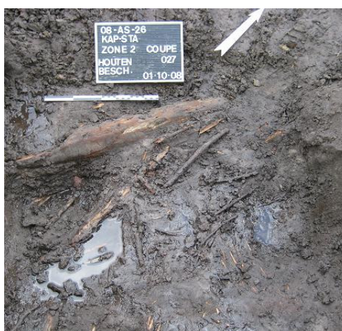
Afbeelding 21 Detail houten beschoeiing in S027