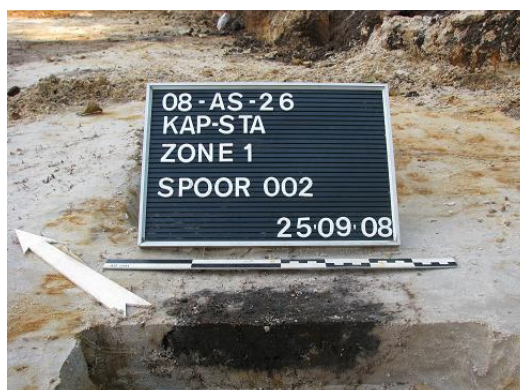
Afbeelding 8 Ondiep paalspoor (?) S002