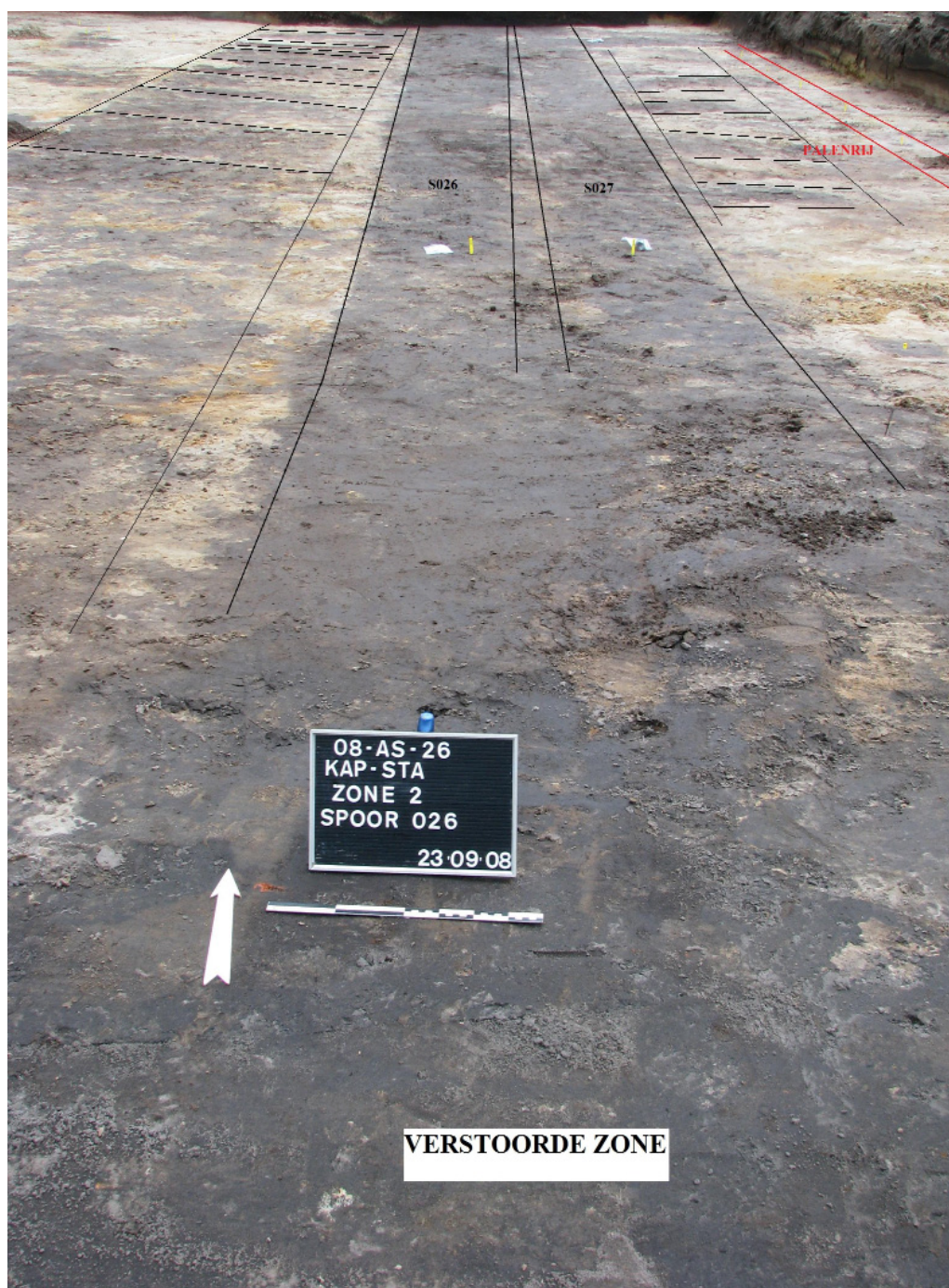
Afbeelding 19 De grachten S026 en S027 (centraal); palerij (rechts in rood); verstoorde zone (onderaan) en rechthoekige verstoringen (links en rechts)