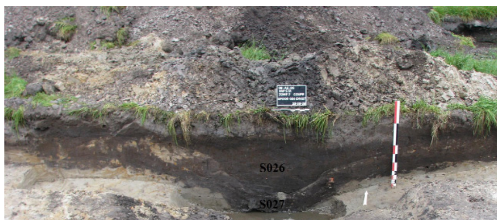
Afbeelding 20 NW - profielwand en de grachten S026 en S027