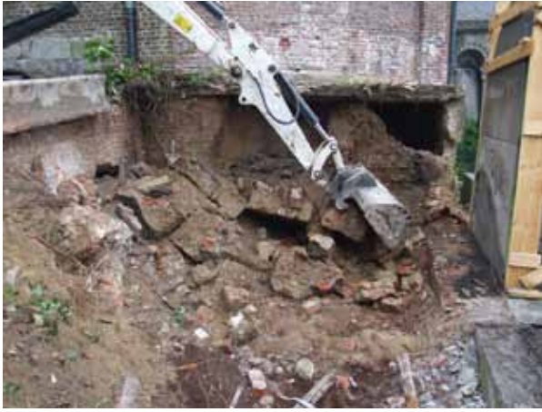
afb. 2: Overzicht van de afbraak van het bijgebouw

Beide constructies startten op het niveau van de 'crypte' of benedenkapel. De toegangsruimte tot de trap(pen) bevond zich ten zuiden van de centraal gelegen 'crypte'. De oudste trapconstructie manifesteerde zich nog slechts door de aanwezigheid van twee treden (afb. 3). Daar het pleisterwerk op de wand nog gedeeltelijk aanwezig was, kon het negatief van de trap nog tot een hoogte van ca. 1 m worden vastgesteld. Of het gaat om een steektrap of een trap van een ander type, kon niet meer worden achterhaald. De recentere trapconstructie was boven de oudere aangelegd. De tussenruimte was met puin opgevuld. Ook voor deze recentere constructie is het niet duidelijk hoe deze eruit zag. Wel is zeker dat deze trap zeker één kwartdraai had (afb. 4). Hiervan zijn de baksteenrestanten bewaard gebleven. Beide trappen gaven vermoedelijk uit op een (tussen)verdieping. Via dit niveau had men dan eveneens toegang tot de kapel. De dichtgemetselde deuropening in het zuidelijke muurvlak van het koor is daar nog een restant van.