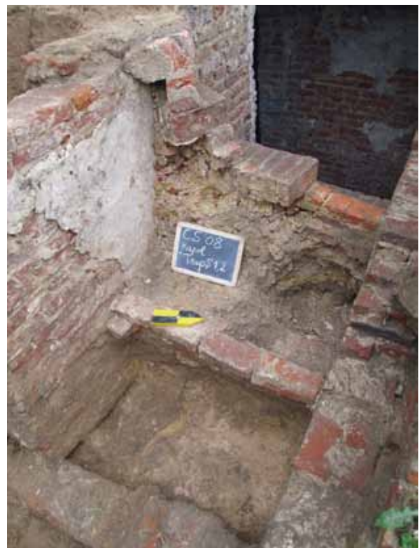
afb. 3: De oudste trapconstructie en de restanten van het pleisterwerk langsheen de trap

sche sporen aangetroffen. Wat de fundering van de kapel betreft, is duidelijk dat deze de helling van de heuvel volgt, aflopend naar het oosten, waardoor deze een zeer grillig verloop kent met verschillende versnijdingen. Het geheel werd opgebouwd met bakstenen van 22 x 11 x 4.5/5 cm en opgevoegd met een witte kalkmortel. Aan de zuidzijde bevindt de onderzijde van de fundering zich op ca. 17.66 T.A.W. Ter hoogte van het koor/de crypte is dit op ca. 16.27 T.A.W. Dit verval werd vastgesteld over een afstand van ca. 4.50 m. De plint in Doornikse kalksteen die ter hoogte van het schip van de kerk zichtbaar is, stopt ter hoogte van het maaiveld. Ook op deze plaats is de fundering opgetrokken uit baksteen.