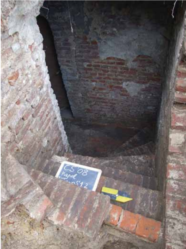
afb. 4: De recentere trapconstructie (Stad Gent, Dienst Stadsarcheologie)