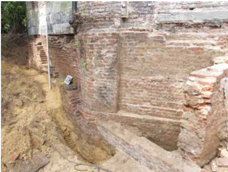
afb. 5: Overzicht van de fundering van de kapel (Stad Gent, Dienst Stadsarcheologie)