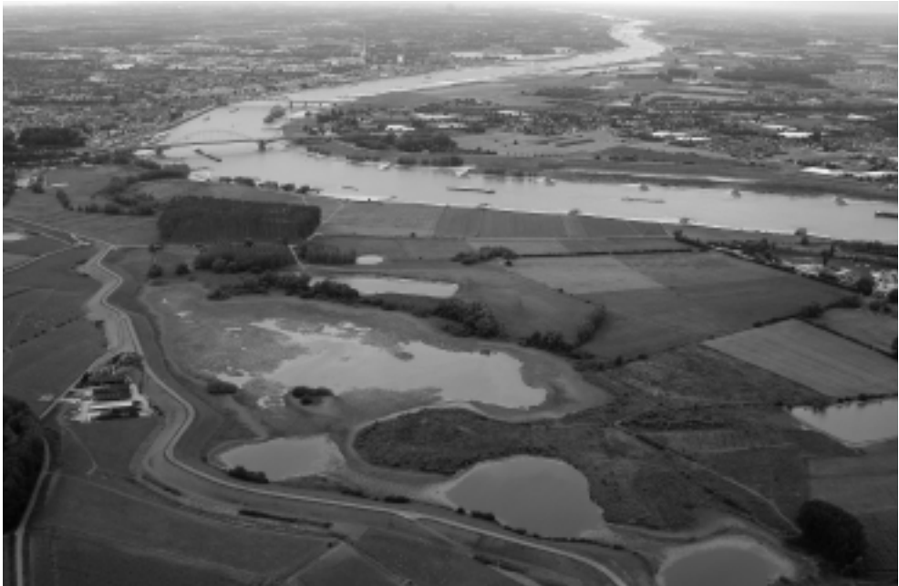
De Ooijpolder en Nijmegen.

‘Vanaf 2006 worden deze uitkomsten en die van het vervolgtraject gebruikt in de discussie over een nieuwe veiligheidsbenadering. Daarin staan het omgaan met overstromingsrisico’s en een mogelijke verdere differentiatie van de veiligheid in Nederland centraal. Dit kan op termijn leiden tot een heroverweging van de huidige normen, bijvoorbeeld een hoger beschermingsniveau voor dichtbevolkte gebieden en een wat lager beschermingsniveau voor dunner bevolkte gebieden. Hierbij past een gedegen communicatietraject over de garanties die het Rijk wel en niet kan bieden’ (Rijksbegroting 2006). 8