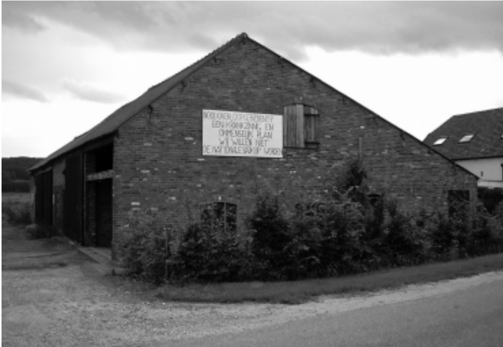
Spandoek in de Ooijpolder.