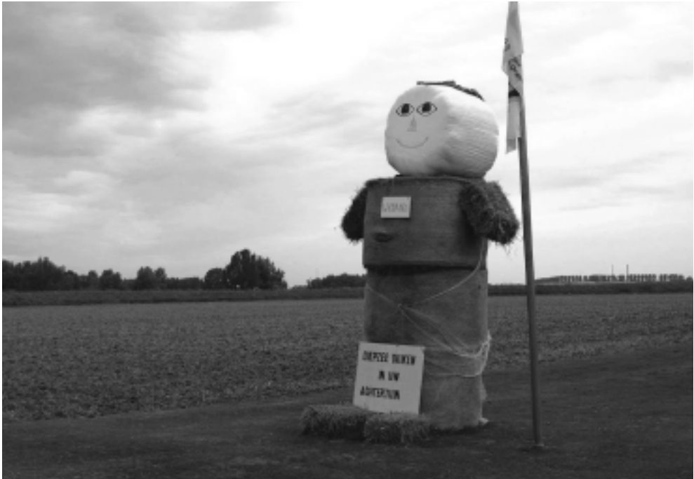
Protest met stropop in de Ooijpolder (foto: Henk Baron, Ooij).