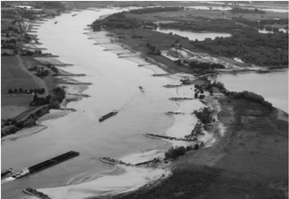
De Waal ter hoogte van de Ooijpolder.

‘Han Vrijling, Matthijs Kok, en Wim Silva stellen: elke dijkring heeft een economisch optimum waarbij kosten en baten in evenwicht zijn. Ik zeg: jullie gaan op de stoel van de politiek zitten. Iedereen moet dezelfde kans hebben, ook al is dat economisch niet optimaal. Ook niet zeuren over 1: 500 of 1:1.000, dat ligt binnen de onzekerheden. In feite moet je logaritmisch werken. Het hele rivierengebied één norm: riviergebied 1:1.000 of 1:10.000, Centraal Holland: 1 op 100.000.’ 25