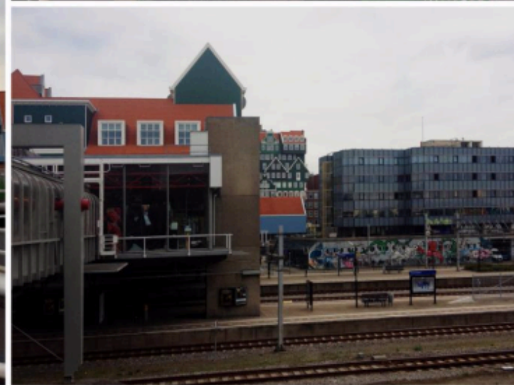
2 - Il progetto di riqualificazione della stazione di Zanddam è un esempio d'interventi sviluppati in modo integrato al fine di conciliare la componente trasportistica e quella urbanistica: è stato ristrutturato l'edificio di stazione e l'area di influenza è stata riqualificata con percorsi pedonali e ciclabili lungo i canali. Il progetto ha inoltre previsto la localizzazione di nuove residenze, attività commerciali ed alberghi, tra cui l'hotel a 4 stelle con il provocatorio progetto dei WAM Architects (Foto di Enrica Papa).