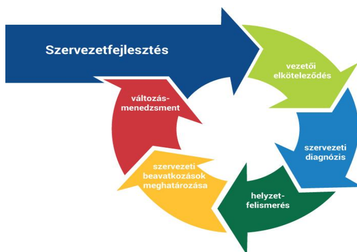
1. ábra: A szervezetfejlesztés folyamata

A szervezetfejlesztés mindig a szervezet egy részének vagy egészének valamely szempont szerinti átalakítására törekszik: ez lehet hatékonyságnövelés, vagy konkrétabb terület is kerülhet a szervezetfejlesztés fókuszába. Ilyen például a vállalati kultúra, a motivációs rendszer, kommunikációs folyamatok átalakítása. (Benedek, 1999): A szervezetfejlesztés kiindulópontja mindig az ember. A szervezetfejlesztés mindig egy mélyebb kutatómunkával, és modellalkotással kezdődik. Alapvető iránymutatásokat fogalmaz meg a szervezetfejlesztési paradigma, de azokat mindig a szervezet karaktereihez kell formálni. Ha a modell elkészült, minden esetben adatgyűjtés következik, amivel mérhető adatok birtokába jut a szervezet fejlesztését végző csapat. Az adatgyűjtés eredményeképpen strukturáltan adatmennyiség áll rendelkezésre, amit statisztikailag elemezni kell. A kapott eredményekből következtetéseket kell levonni. A legfontosabb és egyben a legnehezebb lépés az elemzés eredményének bevezetése. A módosítások gyakorlati bevezetése során gyakran ütközhetünk ellenállásba akár a vezetők, akár a beosztottak részéről. (Bock, 2015)