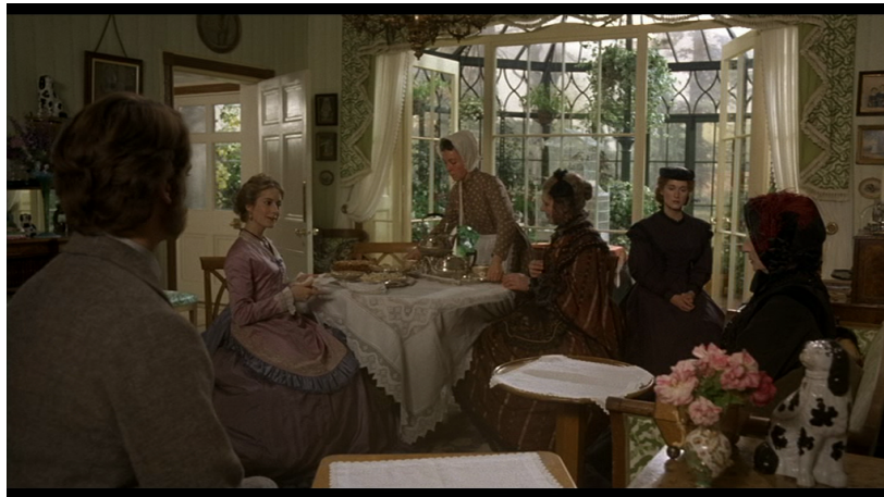
9. kép. Részlet a filmből