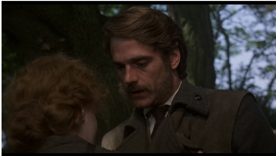
2. kép Síkváltással átlépés a viktoriánus narratívába (részlet a filmből)