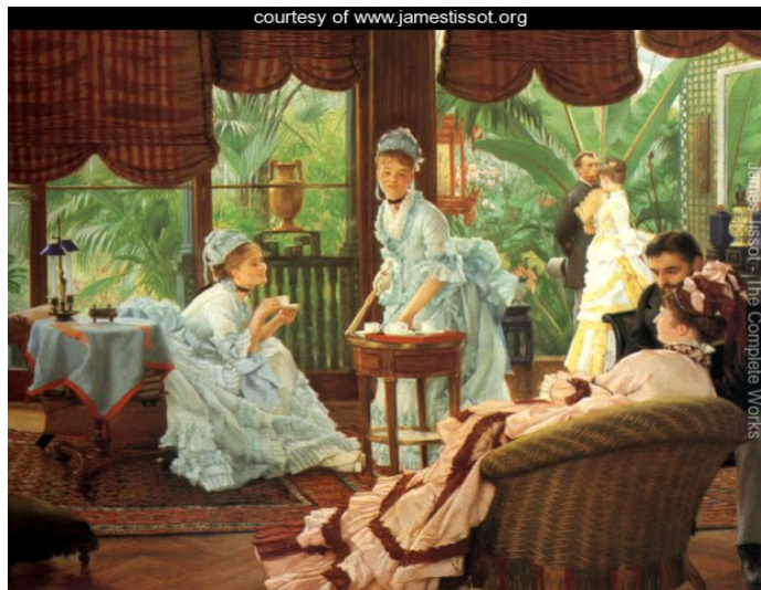
8. kép. Jacques Joseph Tissot: A télikertben

Szintén jelentéssé vizuális allúzióként jelenik meg a filmben Jacques Joseph Tissot francia, de a korabeli Angliában annyira ismert, hogy angolosított névvel (James Tissot) is rendelkező festőnek az angol viktoriánus kornál könnyedebb, szabadabb, frissebb világa is. Épp egy olyan pillanatban, amikor Sarah számos normát megszegve, szinte nyilvánosan randevúra hívja Charlest, miközben a két kép közötti színbeli kontraszt arra is utal: a két világ alaptónusa nem feleltethető meg pontosan egymásnak (8. és 9. kép).