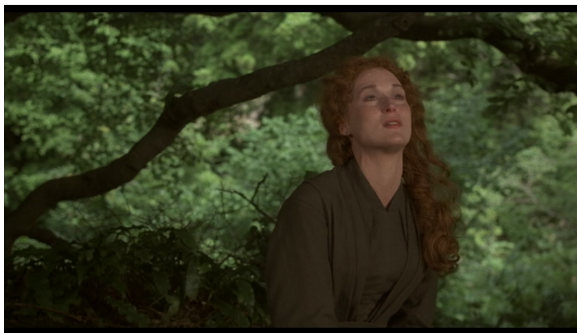
5. kép. Részlet a filmből