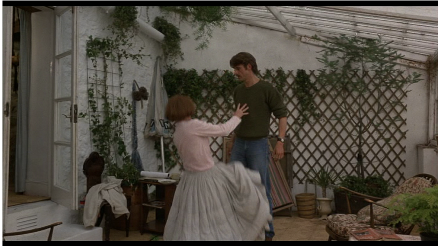
1. kép. A próbajelenet (részlet a filmből)

ajtájának csapódását: nyilvánvalóan Anna távozik, Mike utána szól, azonban nem a filmbeli színész nevét kiáltja utána, hanem a filmbeli karakter nevét, Sarah-t, ezzel összesűrítve a két cselekményszálat, és egyúttal saját szerelmi narratívájuk ambivalens, egyszerre fiktív és valós mivoltát is.