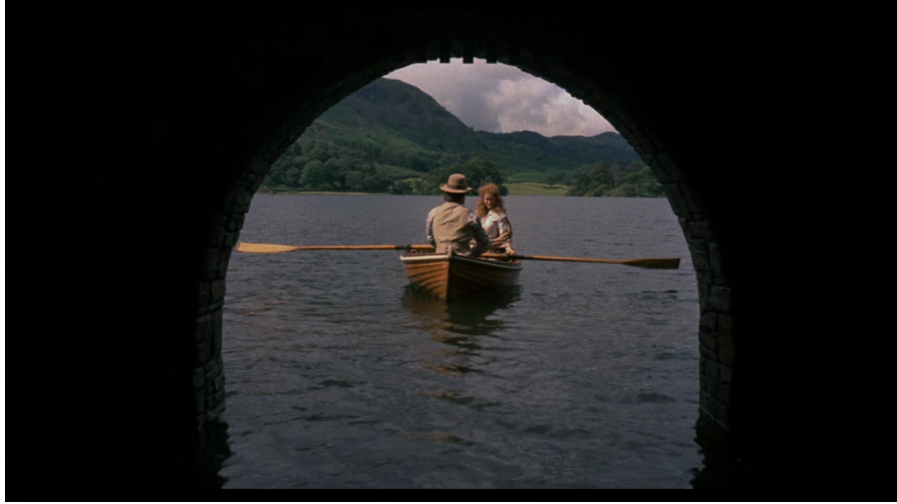
3. kép. Dorset Doodle

Míg tehát a film kiiktatja a cselekményszázból a preraffaelita festőket, a vizuális idézetek révén markánsan vissza is hozza őket: a film mise-en-scene -jei, beásai, jelenetezései, színhasználata, és nem utolsósorban az operatőri munka következetesen a preraffaeliták vizuális világára épül. Ennek legfeltűnőbb eleme – nem véletlenül, mert szinte minden preraffaelita festményen is megjelenő – dús, vörös hajú, a századvégi femme fatale -t megelőlegező nőalak, a preraffaelita festészeti hagyományra jellemző mély zöld színekkel, amelyek különös kontrasztot alkotnak a hatalmas vörös hajkoronával (csak egy példaként ld. 4. és 5. kép).