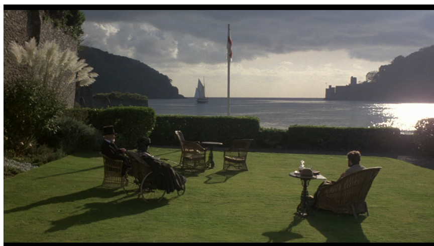
7. kép. Részlet a filmből