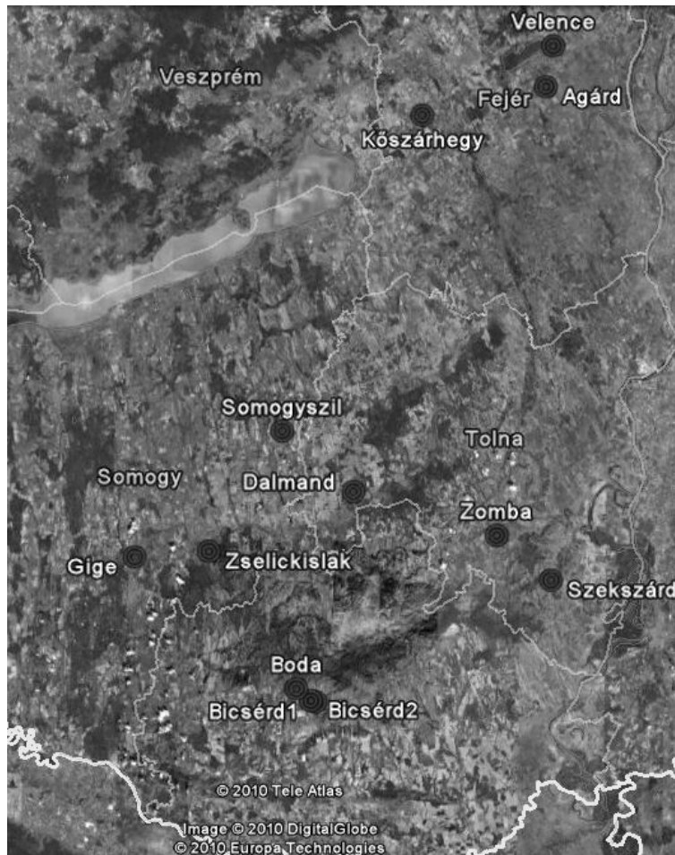
Figure 2: Location of the sampling sites (n=12) of the most common click beetles ( Elateridae: Agriotes spp.) in western Hungary (Transdanubia) in 2010. (Map: GoogleEarth)

A mintavételeket az A. brevis , A. sputator , A. obscurus , A. lineatus és az A. rufipalpis esetén Yatlor-féle csapdákkal, míg az A. ustulatus esetén CsalOMon VarB típusú varsás csapdákkal fajspecifikus feromon segítségével végeztük. A csapdázás során a kereskedelmi forgalomban kapható CsalOMon típusú feromon tartalmú csalétket használtuk (Internet 2).